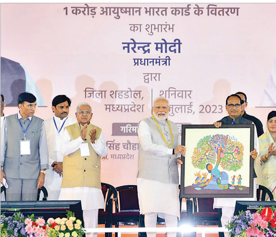
शनिवार को शहडोल में 'सिकल सेल एनीमिया मुक्ति मिशन' के शुभारंभ के दौरान मुख्यमंत्री शिवराज सिंह चौहान द्वारा प्रधानमंत्री नरेन्द्र मोदी को स्मृति चिन्ह भेंट किया गया।

खोलकर मदद की है। मैं आप लोगों से पूछना चाहता हूँ, छत्तीसगढ़ बनाने के पीछे की जरूरत क्या थी? अटल जी चाहते थे आदिवासी भाई आगे आएँ, यही उनकी मंशा थी। आदिवासी समाज के कल्याण के लिए 90 हजार करोड़ रुपये बजट- उन्होंने कहा कि पीएम नरेन्द्र मोदी की आदिवासियों के लिए काम कर रहे हैं। आदिवासी समाज के कल्याण के लिए 90 हजार करोड़ रुपये का अलग से बजट आवंटित कर दिया है। हर साल 15 नवंबर जनजातीय गौरव दिवस मानने का भी ऐलान किया गया। कांग्रेस आदिवासियों को भूल गई। कांग्रेस ने मदद नहीं की इस वजह से आदिवासियों भाइयों को मकान नहीं मिला। इस पर टीएस सिंहदेव ने भी नाराजगी जताई थी। नक्सलवाद कब का खत्म हो जाता, लेकिन हमको सहयोग नहीं मिला। धर्मांतरण पर भी लगाम लगाई जानी चाहिए।