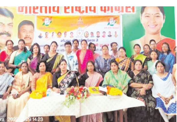
नवीन मेल संवाददाता चाईबासा। चाईबासा कांग्रेस भवन में जिला महिला कांग्रेस कार्यक्रम में मुख्य रूप से महिला कार्यकर्ताओं की बैठक गुरुवार को

थी। उन्होंने संबोधित करते हुए कहा कि केंद्र सरकार महिला विरोधी है। देश का सम्मान बढ़ाने वाली महिला पहलवानों के साथ हुए यौन उत्पीड़न के मामलों को लेकर महीनों दिल्ली में पहलवानों द्वारा धरना प्रदर्शन दिया गया। लेकिन भाजपा सरकार ने आरोपी भाजपा सांसद ब्रजभूषण सिंह को बचाने का काम किया। भाजपा सरकार में महंगाई चरम पर है, रसोई गैस का दाम कम करने का वादा कर सत्ता में आई भाजपा सरकार ने महिलाओं को प्रताड़ित करने का कार्य किया है। महंगाई के कारण महिलाओं को घर गृहस्थी चलाने