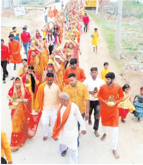
नवीन मेल संवाददाता केरसई। प्रखंड अंतर्गत केरसई भण्डारटोली स्थित नवनिर्मित शिव मंदिर प्राण प्रतिष्ठा कार्यक्रम रविवार को ऐतिहासिक भव्य

कलश यात्रा के साथ आरंभ हुई। कलश यात्रा केरसई खालीजोरा नदी से शुरू हुई, जहाँ सैकड़ों की संख्या से भी अधिक श्रद्धालुओं ने कलश में जल लेकर कलश यात्रा