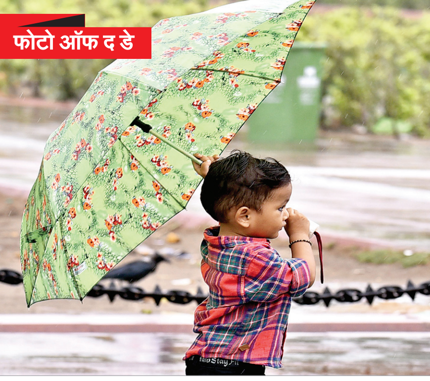
रविवार को दक्षिण-पश्चिम मानसून के दिल्ली में आगे बढ़ने पर बरसात की सुबह इंडिया गेट के पास छाता लिए एक बच्चा।

को अंतिम रूप दिया जाएगा। रक्षा मंत्रालय का कहना है कि ड्रोन की कीमत और खरीद की अन्य शर्तों का जिक्र करते हुए सोशल मीडिया के कुछ हिस्सों में कुछ अटकलबाजी रिपोर्टें सामने आईं। मंत्रालय ने इसे खारिज करते हुए कहा कि इस तरह की अटकलबाजी का उद्देश्य उचित अधिग्रहण प्रक्रिया को पटरी से उतारना है। कीमत और खरीद की अन्य नियम एवं शर्तें अभी तय नहीं की गई हैं और ये बातचीत के अधीन हैं। मंत्रालय ने मीडिया संस्थाओं से अनुरोध किया है कि वे फर्जी खबरें, गलत सूचना न फैलाएं, जो सशस्त्र बलों के मनोबल पर गंभीर प्रभाव डाल सकती हैं। साथ ही अधिग्रहण प्रक्रिया पर भी प्रतिकूल प्रभाव पड़ सकता है।