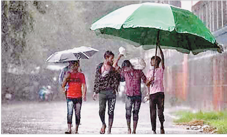
भागों पर मध्यम से हल्की बारिश हुई। अगले पांच दिनों तक जमकर बारिश होने की