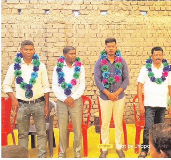
हकर कार्य करें ताकि अपनी समस्याएं दूर होंगी। उन्होंने आगे कहा कि क्षेत्र में जो समस्याएं हैं