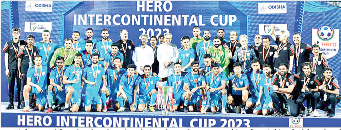
इंटरकॉन्टिनेंटल कप की मेजबानी कराना हमारे राज्य के लिए बेहद शौर्य की बात है। कड़ी प्रतियोगिताओं की मेजबानी के बीच जीत के लिए भारत को और अधिक फुटबॉल प्रतियोगिताओं की मेजबानी का है जिससे कि ओडिशा और भारत में

एजेंसी। भुवनेश्वर ओडिशा के मुख्यमंत्री नवीन पटनायक ने इंटरकॉन्टिनेंटल कप खिताब जीतने के लिए भारतीय पुरुष फुटबॉल टीम को एक करोड़ रुपये का नकद पुरस्कार देने की घोषणा की। भारत ने कप्तान सुनील छेत्री के 87वें अंतरराष्ट्रीय गोल के अलावा लालियानजुआला छंगटे के गोल की मदद से रविवार रात करिंग स्टेडियम में फाइनल में लेबनान को 2-0 से हराकर इंटरकॉन्टिनेंटल कप जीता। पटनायक ने समापन समारोह के दौरान कहा, प्रतिष्ठित