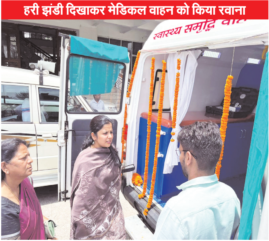
हरी झंडी दिखाकर मेडिकल वाहन को किया रवाना

नवीन मेल संवाददाता रामगढ़। रामगढ़ जिला अंतर्गत सुदूर ग्रामीण क्षेत्र के कुपोषित बच्चों के पोषण स्थिति में सुधार के मद्देनजर मंगलवार को उपायुक्त