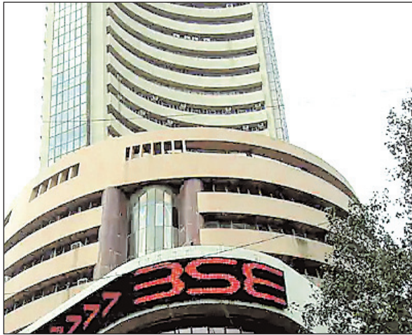
डॉलर के मुकाबले रुपया 2 पैसे मजबूत होकर 82.41 पर खुला है। कल यानी 12 जून को रुपया 82.43 प्रति डॉलर पर बंद हुआ था। कच्चे तेल की कीमतों में आज भी गिरावट जारी है और ये फिसलकर 72.71.50 डॉलर प्रति बैरल पर आ गया है। देश में

फुटकर महंगाई दर मई में घटकर 4.25% पर आ गई है। यह 25 महीनों में महंगाई का सबसे निचला स्तर है। अप्रैल 2021 में महंगाई 4.23% रही थी। खाने-पीने की चीजों के दाम में गिरावट के कारण महंगाई में यह कमी आई है। इससे पहले अप्रैल 2023 में रिटेल महंगाई दर 4.70% रही थी। इससे पहले हफ्ते के पहले कारोबारी दिन यानी सोमवार (12 जून) को शेयर बाजार में बढ़त देखने को मिली थी। संसेक्स 99 अंक बढ़कर 62,724 के स्तर पर बंद हुआ था। वहीं निफ्टी में भी 38 अंकों की तेजी रही, ये 18,601 के लेवल पर बंद हुआ था। संसेक्स के 30 शेयरों में से 20 में तेजी और 10 में गिरावट देखने को मिली थी।