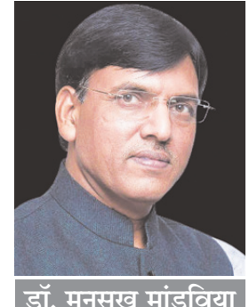
डॉ. मनसुख मांडविया

इंडिया पोर्टल ने भौगोलिक स्थिति के आधार पर न सिर्फ बीमारी बल्कि मामलों की संख्या के आधार पर राष्ट्रीय, राज्य व जिला स्तर पर मांग का आकलन करते हुए आवश्यक आपूर्ति के लिए आवश्यक निगरानी भी की। इस दिनों समान तरीका था और सभी टीका खटवाने के लिए एक ही कतार में खड़े थे। इस सशक्त साधन की क्षमता को देखते हुए, हमारे माननीय प्रधानमंत्री नरेन्द्र मोदी ने इसे दुनिया के लिए एक भेंट के रूप में प्रस्तुत किया। इसी तरह से टेलीमैडिसिन प्लेटफॉर्म ई-संजीवनी, जिसके माध्यम से लोगों को अपने घर पर ही आरामपूर्वक डॉक्टरों के साथ ऑनलाइन परामर्श की सुविधा मिली, शीघ्र ही लोकप्रिय हो गया और इसके माध्यम से 10 करोड़ से अधिक