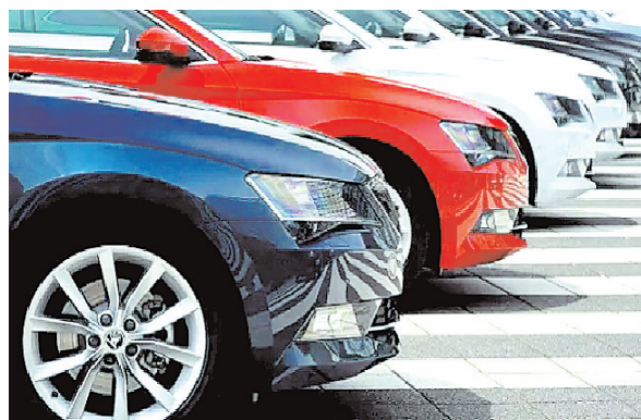
पिछले साल मई, 2022 में निमाताओं ने डीलरों को यात्री वाहनों की 2,94,392 इकाई

अर्थव्यवस्था के मोर्चेपर अच्छी खबर आई है। देश में कार से लेकर दोपहिया वाहनों की बिक्री में उछाल आया है। घरेलू बाजार में यात्री वाहनों (पीवी) की थोक बिक्री मई में सालाना आधार पर 13.54 फीसदी बढ़कर 3,34,247 इकाई रही। सोसाइटी ऑफ इंडियन ऑटोमोबाइल मैनुफैक्चरर्स (सियाम) ने यह जानकारी दी। सियाम ने मंगलवार को जारी आंकड़ों में बताया कि यात्री वाहनों की थोक बिक्री मई में 3,34,247 इकाई रही।