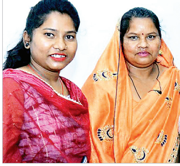
मैं ठान ली। ऐसा सोच लोकेश्वरी मुख्यमंत्री नोनी सशक्तिकरण योजना की जानकारी मिली। लोकेश्वरी ने बिना देरी किए

श्रीमती नोनी सशक्तिकरण योजना मजदूरों के बेटियों के लिए बनी हुई है। इस योजना के तहत अब तक जिले के 1999 हितग्राही लाभान्वित हो चुकी है। वहीं योजना के लिए कुल 4112 आवेदन मिले हैं। योजना की राशि को कई मजदूरों की बेटियां पढ़ाई-लिखाई, प्रतियोगी परीक्षाओं की तैयारियों आदि के लिए कर रही है। मुख्यमंत्री नोनी सशक्तिकरण योजना से मजदूरों की बेटियां शिक्षित व सक्षम बन रही है। इस पहल न सिर्फ वंचित वर्ग की बेटियों को लाभ हो रहा है, बल्कि उनके परिवार को भी आर्थिक रूप से संबल मिल रहा है। महिला सशक्तिकरण की दिशा में इस पहल से राज्य के सर्वांगीन