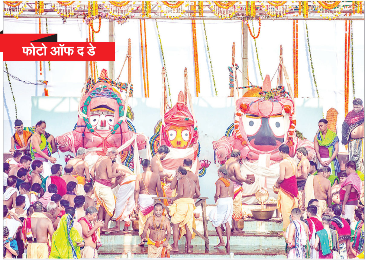
फोटो ऑफ द डे

एजेंसी। बाड़मेर राजस्थान के बाड़मेर जिले के मंडली थाने के बानियावास गांव में एक महिला ने अपने चार बच्चों की हत्या कर खुद फांसी लगाकर आत्महत्या कर ली। महिला ने पहले चारों बच्चों को अनाज के ड्रम में बंद कर उनकी जान ले ली। घटना की जानकारी मिलते ही पुलिस अधिकारी मौके पर पहुंचे और पांचों शवों को हॉस्पिटल पहुंचाया। हत्या