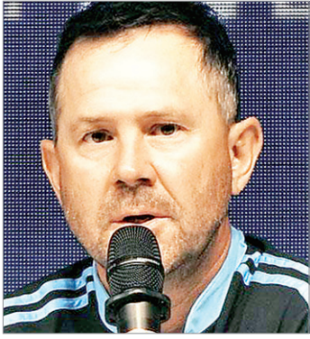
ऑस्ट्रेलिया के खिलाफ 24 टेस्ट मैचों में 2033 रन और पांच शतक बना लिए हैं और अब जब टीमों 7 जून से डब्ल्यूटीसी फाइनल में भिड़ेंगी तो भारत की

एजेंसी। नई दिल्ली ऑस्ट्रेलिया के पूर्व कप्तान रिची पोटिंग का मानना है कि चेतेश्वर पुजारा और विराट कोहली आईसीसी विश्व टेस्ट चैम्पियनशिप (डब्ल्यूटीसी) के फाइनल में भारत की उम्मीदों की कुंजी हो सकते हैं। उन्होंने साथ ही कहा कि ऑस्ट्रेलियाई टीम आगामी मैच से पहले उम्मीद के मुताबिक बल्लेबाजी के इन दिग्गजों पर चर्चा करेगी। पुजारा ने किसी भी अन्य टीम की तुलना में ऑस्ट्रेलिया के खिलाफ अधिक टेस्ट रन और शतक बनाए हैं और पोटिंग के अनुसार डब्ल्यूटीसी फाइनल में महत्वपूर्ण भूमिका निभाने के लिए पुजारा उस रिकॉर्ड की ओर मुड़ सकते हैं। नंबर 3 के विश्वसनीय बल्लेबाज ने पहले ही