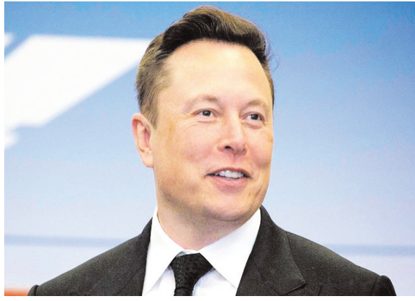
एजेंसी। वॉशिंगटन ने फ्रांस के बर्नार्ड अरनॉल्ट को पीछे छोड़कर दुनिया के

सबसे अमीर व्यक्ति की पोजिशन फिर से हासिल कर ली है। बीते 5 दिनों में टेस्ला का शेयर 12.04% बढ़कर 203.93 डॉलर पर पहुंच गया है जिस कारण मस्क की नेटवर्थ बढ़ी है। ब्लूमबर्ग बिलेनियर्स इंडेक्स के अनुसार मस्क की कुल नेटवर्थ 192 बिलियन डॉलर (करीब 15.85 लाख करोड़ रुपए) हो गई है। वहीं दुनिया के सबसे बड़े फैशन ग्रुप लुई वित्तो मोएट हेनेसी के उइड बर्नार्ड अरनॉल्ट की नेटवर्थ 187