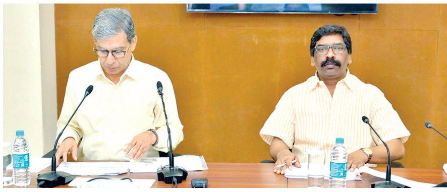
मुख्य रूप से इन परियोजनाओं की हुई समीक्षा

मुख्यमंत्री ने विभागों के प्रधान सचिव और सचिव को कहा कि वे हर महीने अपना शेड्यूल तय करें। इसमें कम से कम तीन से चार दिन फील्ड विजिट को शामिल करें, ताकि साइट पर उन्हें तमाम योजनाओं का जमीनी हकीकत