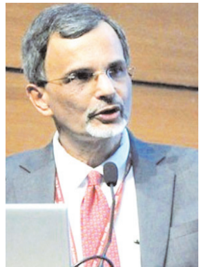
नई दिल्ली

2022-23 के लिए विकास दर 7.2 फीसदी रहने का अनुमान लगाते हुए सरकार ने बुधवार को कहा कि चालू वित्तवर्ष (2023-24) के लिए जीडीपी के 6.5 फीसदी रहने का अनुमान संभव है। मुख्य आर्थिक सलाहकार (सीईए) वी. अनंत नागेश्वरन ने 2022-23 की चौथी तिमाही और पूरे वित्तवर्ष के लिए जीडीपी डेटा जारी होने के बाद संवाददाताओं से यह बात कही। अधिकारिक आंकड़ों के अनुसार, भारत ने 2022-23 की जनवरी-मार्च अवधि में 6.1 प्रतिशत की जीडीपी वृद्धि दर्ज की, जबकि पिछली