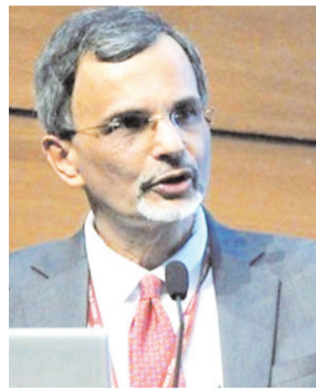
एजेंसी। नई दिल्ली

2022-23 के लिए विकास दर 7.2 फीसदी रहने का अनुमान लगाते हुए सरकार ने बुधवार को