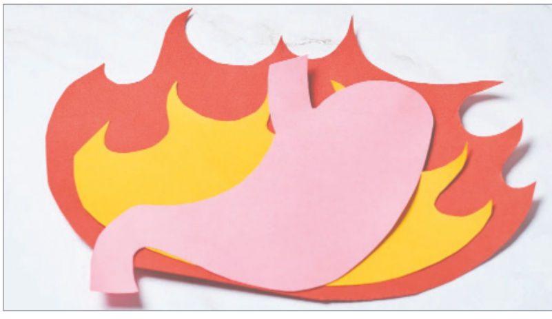
गैस और एसिडिटी से नहीं मिल रही कोई राहत तो अजमाएं ये आयुर्वेदिक उपचार

धनिया ठंडा होता है, इसलिए ये पेट की समस्याओं जैसे जलन, गैस और एसिडिटी से राहत दिलाने में मददगार होता है। आयुर्वेद के अनुसार, पेट की समस्याओं से जूझ रहे लोगों को सुबह उठते ही सबसे पहले धनिये की चाय का सेवन करना चाहिए। रोजाना इसका सेवन करने से हफ्तेभर में एसिडिटी जैसी समस्याओं से राहत मिल जाती है। धनिया की चाय बनाने के लिए 1 से पच जाता है। इसके अलावा ये एसिडिटी जैसी