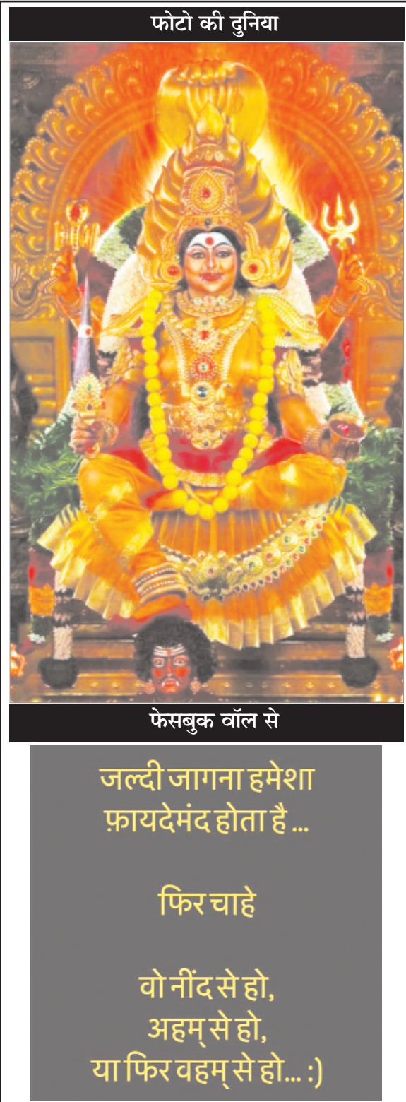
फोटो की दुनिया

अमेरिका ही है। 2021 में पूरी दुनिया में स्वास्थ्य क्षेत्र पर हुए साइबर हमलों में से अकेले अमेरिका पर 28 प्रतिशत हमले हुए थे। ये दुनिया के तेजी से बढ़ते डिजिटलीकरण का नतीजा है, विशेष रूप से कोविड-19 महामारी के कारण ऐसा हो रहा है। एक अन्य सॉफ्टवेयर सुरक्षा कंपनी इंडसफेस ने कहा कि उसके ग्राहकों पर दस लाख से ज्यादा साइबर हमले हुए, इनमें से 2,78,000 हमले भारत में हुए।