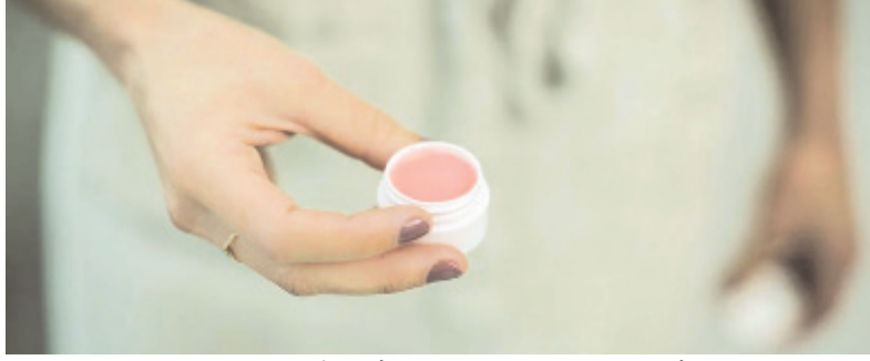
उसमें नारियल तेल, कोको बटर और बीवैक्स डालकर पिघलाएं। ● आप इसे चम्मच की मदद से तब तक हिलाएं जब तक कि बीवैक्स पूरी तरह से पिघल न जाए। ● जब यह पिघल जाए तो इसे आंच से उतार

सही तरह से पैम्पर करना चाहिए। ऐसे में लिप को मॉइश्चराइज करने और उनकी खूबसूरती बढ़ाने का सबसे अच्छा तरीका है कि लिप बाम का इस्तेमाल किया जाए। यूं तो आपको मार्केट में भी लिप बाम मिल जाएंगे। लेकिन अगर आप चाहें तो इसे खुद घर पर भी बना सकते हैं। ● 2 बड़े चम्मच नारियल का तेल ● 1 बड़ा चम्मच कोको बटर ● 1.5 बड़ा चम्मच बीवैक्स ● 10 बूंद पेपरमिंट एसेंशियल ऑयल लिप बाम बनाने के तरीके ● सबसे पहले एक डबल बॉयलर लें और