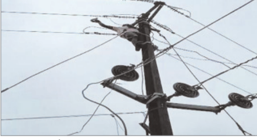
गुल रह रही है जबकि ग्रामीण इलाकों में 10 से 12 घंटे तक बिजली की कटौती की जा रही है।

मेदिनीनगर। पलामू में लोग भीषण गर्मी से परेशान हैं, ऐसे में बिजली अनियमित कटौती लोगों को और बेहाल कर दे रही है। गर्मी में बिजली की आंख-मिचौली से आम जनता की परेशानी और भी बढ़ गई है। पढ़ाई करने वाले विद्यार्थियों को भी पढ़ाई करने में परेशानी हो रही है। जहां दिन में भीषण गर्मी से लोगों का हाल बुरा है वहीं दूसरी ओर बिजली नही रहने के वजह से सप्लाई पानी भी टंकी में नहीं चढ़ पा रहा है। सोमवार को शहर में पानी की सप्लाई बिजली के कारण ही बंद रहा। जिला मुख्यालय संयत जिले के सभी शहर और सभी पंचायतों का एक ही हाल है। शहरों में 4- 5 घंटों से बिजली