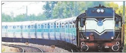
ही उक्त दोनों स्टेशनों पर ट्रेन स्टॉपिंग की सुविधा प्राप्त हुई है। उन्होंने संसदीय क्षेत्र की जनता से आग्रह किया है कि इस पुनीत अवसर पर सभी उपस्थित होकर अपनी चिर परिचित मांग को पूर्ण होने का साक्षी बने। उन्होंने पीएम एवं रेल मंत्री के प्रति अपनी ओर से एवं पलामू संसदीय क्षेत्र की समस्त जनता की ओर से धन्यवाद एवं अभार प्रकट किया है।

नवीन मेल संवाददाता मेदिनीनगर। पलामू सांसद वीडी राम के अथक प्रयासों के फलस्वरूप रांची सासाराम इंटरसिटी एक्सप्रेस ट्रेन संख्या 18635/18636 का आज से विधिवत परिचालन प्रारंभ हो रहा है। इस अवसर पर आज उक्त ट्रेन का विधिवत परिचालन का शुभारंभ प्रातः 4:48 बजे हैदरनगर स्टेशन पर एवं रात्रि में 10:20 बजे उंटारी रोड स्टेशन पर सांसद के द्वारा हरी झंडी दिखाकर किया जाएगा। उंटारी रोड स्टेशन पर परिचालन के पूर्व 08:30 बजे रात्रि में उद्घाटन कार्यक्रम का आयोजन किया जाएगा। ट्रेन के ठहराव की मांग हैदरनगर एवं उंटारी रोड प्रखंड की जनता द्वारा लगातार की जा रही थी। इस ट्रेन के ठहराव हेतु किए गए प्रयासों के फलस्वरूप