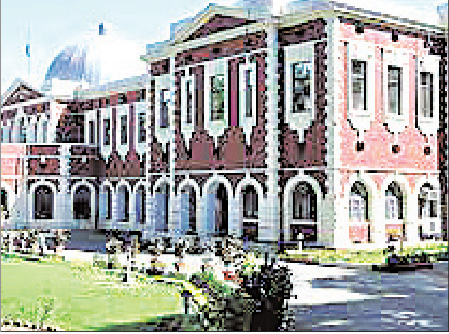
मामले में 14 अल्ट्रासाउंड क्लिनिकों की ओर से हस्तक्षेप याचिका दायित्व कर कोर्ट द्वारा इनके