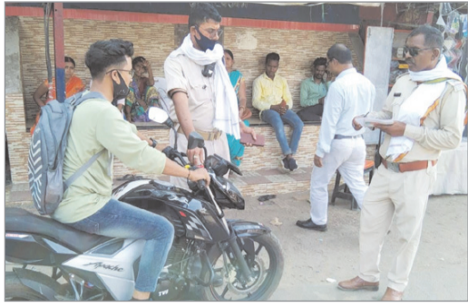
इंजिन लाइसेंस था और ना ही गाड़ी के कागजात थे। उन्होंने वाहन चालकों से आग्रह किया है कि चार पहिया वाहन चलाते समय सीट