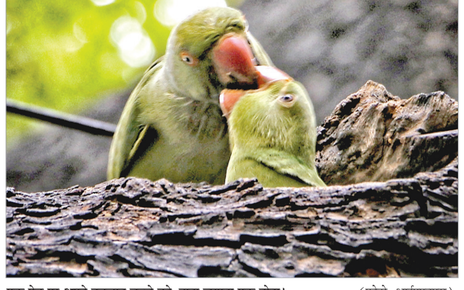
एक पेड़ पर अपने नवजात बच्चे को दाना चुगाता एक तोता।