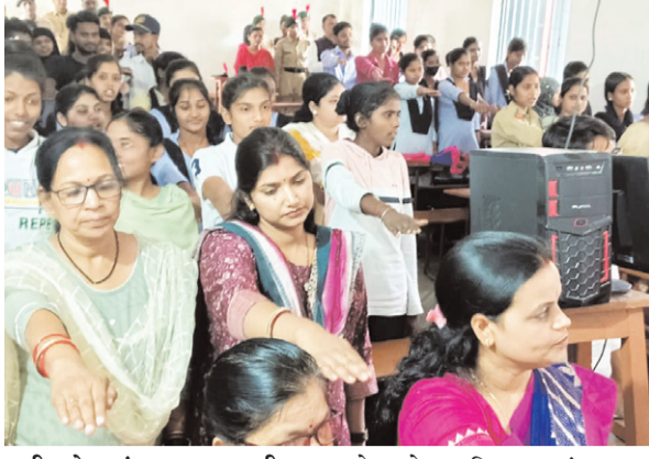
नवीन मेल संवाददाता। बरही सजल भारत, हरित भारत के उद्देश्यों को सफल बनाने के

उद्देश्य से प्राकृतिक जलसंरक्षण पर आरएनआईएम कॉलेज बरही में एक दिवसीय कार्यशाला का