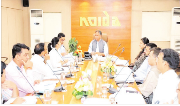
लिये 500 करोड़ और न्यू नोएडा (डीएनजीआईआर) के लिए 1000 करोड़ रूपए का प्रावधान किया गया है। वहीं विकास कार्यों पर 1906 करोड़ रूपए खर्च किए जाएंगे। इसमें निर्माणधीन परियोजनाएं सेक्टर-96 में प्रशासनिक कार्यालय, चिल्ला रेगुलेटर से महामाया फ्लाई ओवर तक एलिवेटेड रोड, अगाहपुर से

में कुल खर्च करने का लक्ष्य 6,503 करोड़ रूपए रखा गया है जिसे बढ़ाया गया है। दरअसल 2022-23 में 4,880.62 करोड़ का बजट था। जिसमें 4579.52 करोड़ विकास पर खर्च होने थे। लेकिन, राजस्व 132 प्रतिशत अधिक और खर्च बजट से 108 प्रतिशत अधिक हुआ। यानी विगत वर्ष में आय और व्यय दोनों ही निश्चित लक्ष्य से ज्यादा हुआ। इसकी बड़ी वजह औद्योगिक, आवासीय, ग्रुप हाउसिंग और वाणिज्यिक भूखंडों का ई ऑक्शन रानी के अलावा अन्य अधिकारी मौजूद रहे। वित्तीय वर्ष 2023-23