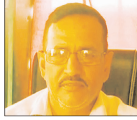
जल नल योजना पर प्रतिक्रिया देते 20 सूत्री अध्यक्ष व प्रमुख सहित सभी जनप्रतिनिधियों के फोटो।