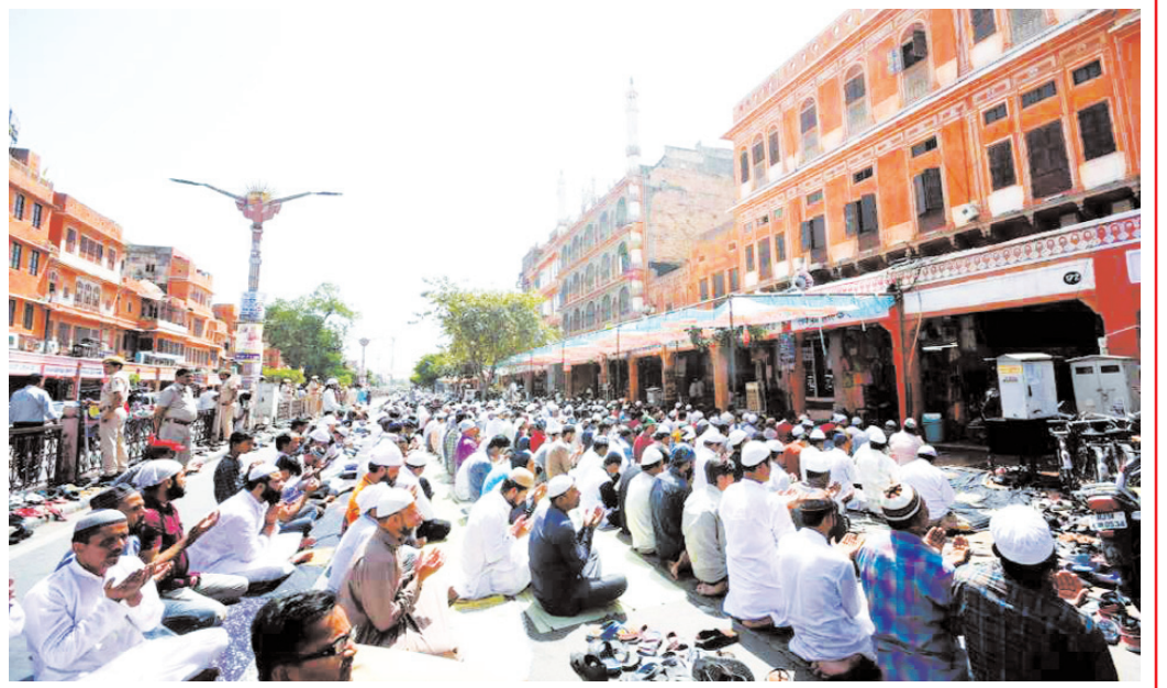
जयपुर : शुक्रवार, 07 अप्रैल, 2023 को जयपुर में जामा मस्जिद के बाहर रमजान के पवित्र महीने में जुमा की नमाज अदा करते मुस्लिम समुदाय के लोग।