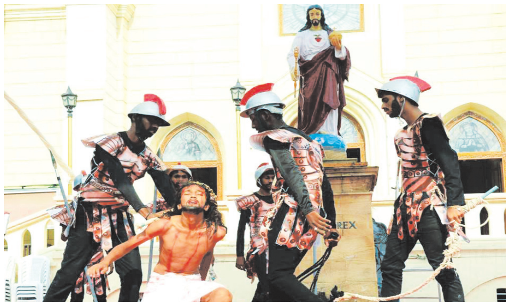
नागपुर : भारतीय ईसाइयों ने शुक्रवार, 07 अप्रैल, 2023 को नागपुर के एसएफएस चर्च में गुड फ्राइडे के अवसर पर ईसा मसीह को सूली पर चढ़ाने का कार्यक्रम प्रस्तुत किया।

मुंबई। बॉलीवुड के मेगा-स्टार सलमान खान ने मिल रही धमकियों के बीच आत्मरक्षा के लिए बुलेट प्रूफ एसयूवी के बाद अब एक शानदार व्हाइट बुलेट प्रूफ एसयूवी खरीदी है जिसमें वो शहर का चक्कर लगाते हैं। अभिनेता के करीबी सूत्रों ने यह जानकारी दी। पहले से ही सलमान खान को वाई-प्लस सिक्सोरेटि कवर दी जा चुकी है, लेकिन रिस्क न लेते हुए उन्होंने अपने लिए निसान पेट्रोल एसयूवी इंपोर्ट कराई है। यह आर्मर्ड और बुलेटप्रूफ ग्लास के साथ उनके पूर्व मांडिफाई टोयोटा लैंड क्रूजर का अपग्रेड होगा।