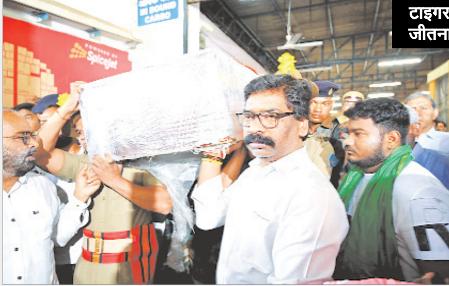
मुख्यमंत्री दिवंगत जगरनाथ महतो के अलारगो स्थित पैतृक आवास पर पहुंचकर शोकाकुल परिजनों से मिले और शेष पृष्ठ 11 पर