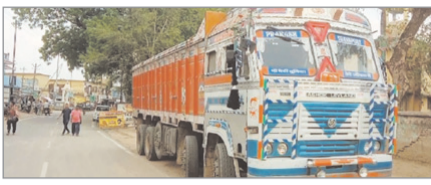
नवीन मेल संवाददाता विश्रामपुर। पांडू मुख्य पथ पर बाजार के समीप एक कार व ट्रक में भिड़ंत हो गई। हालांकि इस घटना में कोई हताहत नहीं हुआ है। मिला जानकारी के अनुसार पांडू की ओर से आ रही ट्रक सीजी 15 सीजेड 4421 व सेलेरियो कार जेएचओ 13 3985 साइड लेने के क्रम में आपस में टकरा गई। जिससे घंटा सड़क जाम रहा। मौके पर पुलिस पहुंच कर दोनों दुर्घटना ग्रस्त वाहन को थाना ले आई। हलांकि इस घटना में कोई हताहत नहीं हुआ है। दोनों वाहन में बैठे लोग सुरक्षित हैं। वहीं मामले की पुलिस जांच कर रही है।

कोई हताहत नहीं हुआ है। मिला जानकारी के अनुसार पांडू की ओर से आ रही ट्रक सीजी 15 सीजेड 4421 व सेलेरियो कार जेएचओ 13 3985 साइड लेने के क्रम में आपस में टकरा गई। जिससे घंटा सड़क जाम रहा। मौके पर पुलिस पहुंच कर दोनों दुर्घटना ग्रस्त वाहन को थाना ले आई। हलांकि इस घटना में कोई हताहत नहीं हुआ है। दोनों वाहन में बैठे लोग सुरक्षित हैं। वहीं मामले की पुलिस जांच कर रही है।