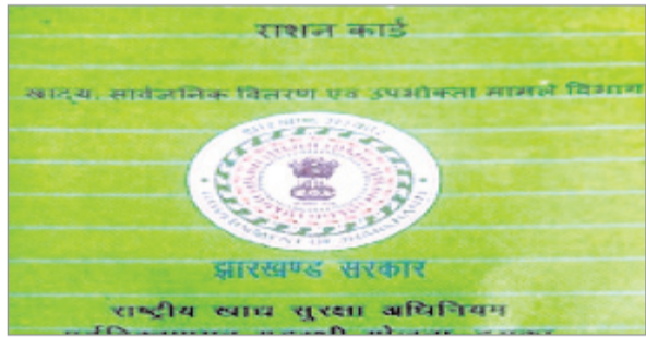
कालाबाजारी की शिकायत के बाद खाद्य एवं आपूर्ति विभाग कार्डधारकों की जांच करा रहा था। जांच में सैकड़ों फर्जी कार्डधारकों पकड़े गए। अब राज्य में 4.62

नवीन मेल संवाददाता। रांची। राज्य के 4.62 लाख ग्रीन कार्डधारकों को अप्रैल में एकमुश्त चार महीने का 2.88 क्विंटल चावल मिलेगा। राज्य सरकार ने सितंबर से दिसंबर 2022 के अनाज का आवंटन कर दिया है। राज्य के 25,462 डीलर चावल का वितरण करेंगे। झारखंड में सितंबर से ही ग्रीन कार्ड धारकों को खाद्यान्न नहीं मिल रहा था।