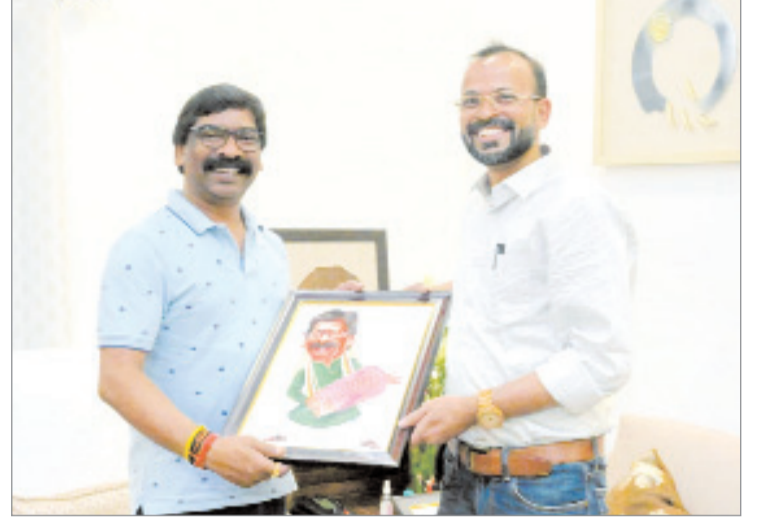
रांची। मुख्यमंत्री हेमंत सोरेन से मंगलवार को कार्टूनिस्ट और कैरिकेचर कलाकार दिशोम गुरु श्री शिबू सोरेन और मुख्यमंत्री मनोज सिन्हा ने औपचारिक मुलाकात की। इस अवसर पर उन्होंने खुद से उकेरी गई तस्वीर उन्हें संप्रेषण की।