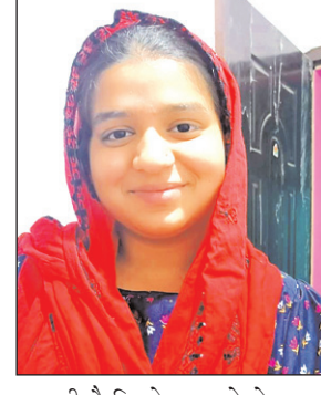
कहती है कि रोजा रखने से