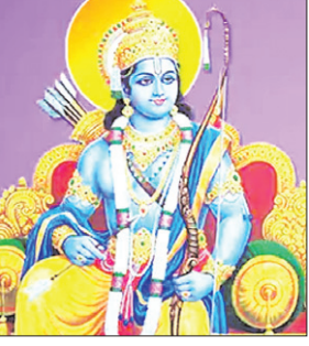
नवीन मेल संवाददाता मेदिनीनगर। चैनपुर महावीर नवयुवक दल जनरल शाहपुर के तत्वावधान में

रामनवमी पूजा में झांकी के अच्छे प्रदर्शन, रथ व साउंड के साथ राम भक्तों के लिए भंडारे का आयोजन करने वाले लोगों को शुक्रवार की रात सम्मान समारोह आयोजित कर शौल्ड, मेडल व तलवार देकर और पगड़ी बांध कर सम्मानित किया गया। जिसमें सत्य प्रेम संघ को झांकी और साउंड में अच्छे प्रदर्शन को लेकर प्रथम पुरस्कार और चंद्रशेखर आजाद क्लब को द्वितीय पुरस्कार से सम्मानित किया गया। रामभक्तों एवं ग्रामीणों के लिए शरबत पानी चना