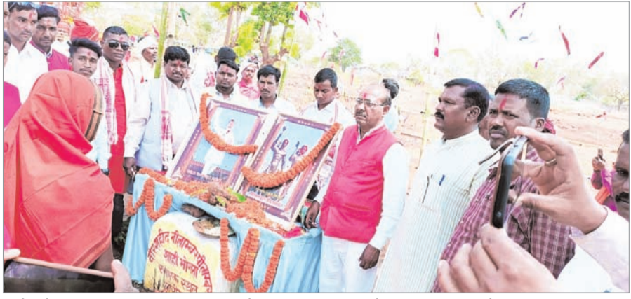
नवीन मेल संवाददाता। बारियातु प्रखंड मुख्यालय स्थित कड़का

नदी के समीप मंगलवार को जंग-ए-आजादी के महानायक,