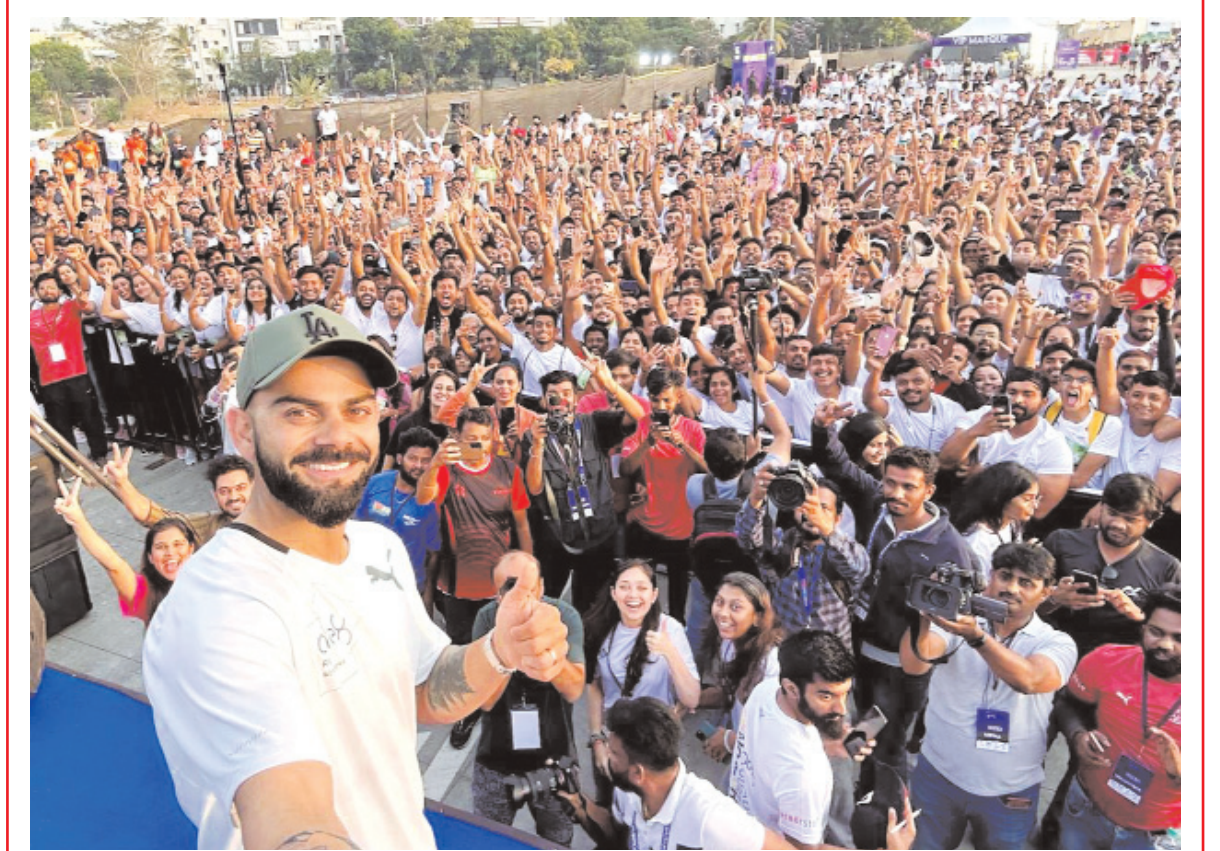
बंगलुरु : भारतीय क्रिकेटर विराट कोहली बंगलुरु में फैंस का अभिवादन स्वीकार कर सेल्फी लेते हुए।

अत्यधिक अनुभवी खिलाड़ी सभी समर्थन प्रदान करेंगे, जिसकी नीतीश को मैदान पर आवश्यकता हो सकती है। हम उनकी कामना करते हैं। अपनी नई भूमिका में सर्वश्रेष्ठ और श्रेयस पूरी तरह से और तेजी से ठीक हो रहे हैं।