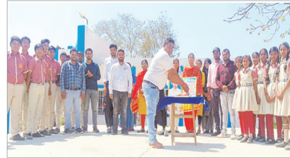
तीनों क्रांतिकारियों की कहानी बताई। इसके बाद ही पूरे देश में क्रांति तेज हुई और देश आजाद हुआ। आज भी भगत सिंह, राजगुरु और सुखदेव की जीवनी प्रेरणा के स्रोत हैं। प्राचार्य ने भी इनके बलिदान की कहानी बताते हुए सिख लेने की सलाह दी। इनके बताए रास्ते पर चलने की