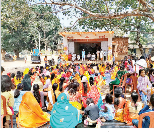
पश्चात श्री बजरंगबली मंदिर पहुंची इससे पूर्व हर हर महादेव और भगवा रंग के रंग