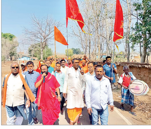
कलश यात्रा पूरे गांव का भ्रमण करने के