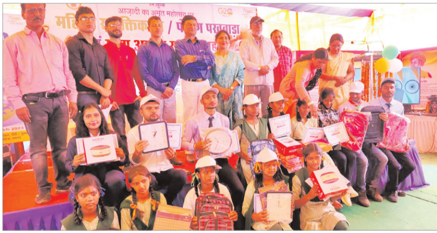
प्रति जानकारी देने के क्रम में सभी को मोटा अनाज अपने आहार में शामिल करने की अपील की। 3 दिनों तक चले मल्टीमीडिया प्रदर्शनी कार्यक्रम के दौरान विभिन्न प्रतियोगिताओं के विजेताओं को सम्मानित करने के उपरांत उप विकास आयुक्त ने उपस्थित सभी बच्चों को किसी भी प्रतियोगिता में हार व जीत की परवाह किए बिना