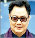
राहुल की टिप्पणी से कांग्रेस पार्टी डूब रही है : रिजिजू