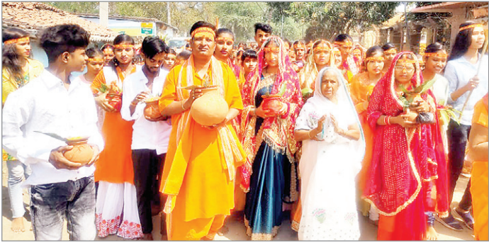
सहित सैकड़ों भक्त शामिल थे।