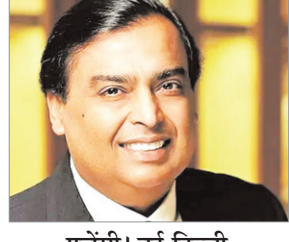
एजेंसी। नई दिल्ली अडाणी ग्रुप के चेयरमैन गौतम

अडाणी दुनिया के सबसे अमीर कारोबारियों की लिस्ट में दूसरे नंबर से फिक्सलकर 23वें नंबर पर आ गए हैं। बुधवार को टॉप हुरुन ग्लोबल रिच लिस्ट 2023 जारी की गई है जिसमें ये जानकारी सामने आई है। नेटवर्क में साल-दर-साल 35% की गिरावट के साथ, अडाणी की कुल नेटवर्थ 53 बिलियन डॉलर है। हुरुन