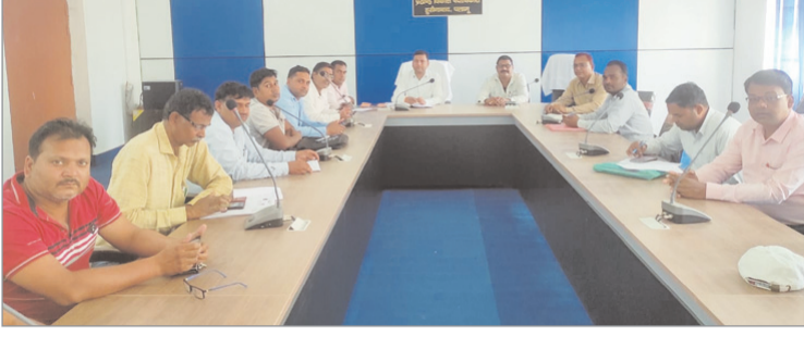
शिफ्टिंग,मजदूरों को 100 दिन का रोजगार सुजन, सभी पंचायतों में एक-एक खेल मैदान का निर्माण समेत अथुरे योजनाओं को यथाशीघ्र पूर्ण करने,मनरेगा मजदूरों को