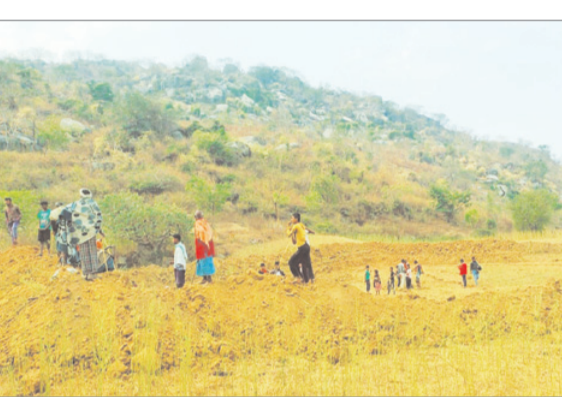
मैदान का निर्माण समेत अथुरे योजनाओं को यथाशीघ्र पूर्ण करने,मनरेगा मजदूरों को