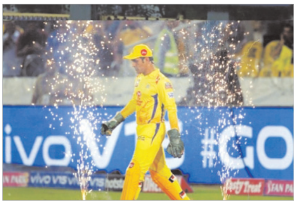
में कोविड के बाद पहली बार यह उल्लेखनीय होने जा रहा है। आईपीएल में होम अवे मैच होंगे। चेपाक स्टेडियम में सीएसके

एजेंसी। नई दिल्ली। ऑस्ट्रेलिया के पूर्व सलामी बल्लेबाज मैथ्यू हेडन का मानना है कि करिश्माई विकेटकीपर-बल्लेबाज एमएस धोनी की विदाई इंडियन प्रीमियर लीग (आईपीएल) के 2023 सीजन में खास होगी। आईपीएल 2023 के होम और अवे प्रारूप में वापस आने के साथ, यह चेन्नई सुपर किंग्स को इस साल एमए चिदंबरम स्टेडियम में अपने घरेलू मैच खेलने का मौका देगा, जो आईपीएल में एक खिलाड़ी के रूप में धोनी का अंतिम अभियान हो सकता है। उन्होंने कहा: 2023