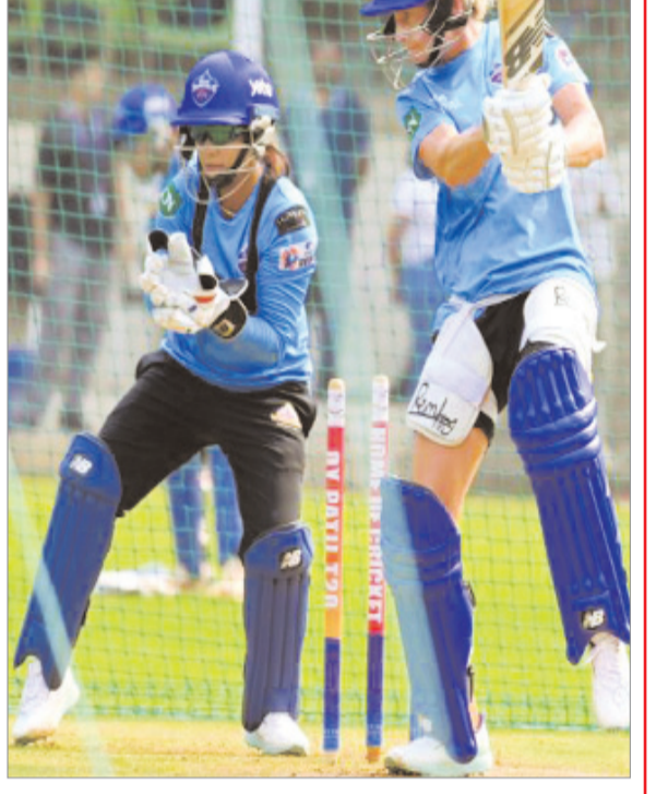
मिले। लेकिन मैच इसी तरह चलता है। आप कुछ जीतते हैं और आप कुछ हार जाते हैं। हमें जल्दी से बाउंस बैक करने की जरूरत है। ऑस्ट्रेलियाई दिग्गज ने यह भी बताया कि दिल्ली कैपिटल्स जल्दी से पिच के अनुकूल नहीं हुई। उन्होंने कहा: मुंबई इंडियंस के खिलाफ हमारे मैच के दौरान विकेट थोड़ा अलग था। मुझे लगा कि उस विकेट पर 150 रन एक अच्छा स्कोर होगा। पिच पहले की तुलना में अधिक गेंदबाजों के अनुकूल थी और हम विकेट से उतनी जल्दी तालमेल नहीं बिठा पाए जितना हम चाहते थे। दिल्ली कैपिटल्स अपने अगले मैच में शनिवार को डीवाई पाटिल स्पोर्ट्स एकेडमी, नवी मुंबई में गुजरात जायंट्स से भिड़नी

एजेंसी। मुंबई। मुंबई इंडियंस के खिलाफ आठ विकेट से हारने के बाद दिल्ली कैपिटल्स को चल रही महिला प्रीमियर लीग 2023 में पहली हार का सामना करना पड़ा। दिल्ली की कप्तान मेग लैनिंग को लगता है कि टूर्नामेंट में उनकी टीम को बाउंस बैक करने की जरूरत है। डीवाई पाटिल स्पोर्ट्स एकेडमी में गुरुवार को दिल्ली कैपिटल्स की टीम 105 रन पर आलआउट हो गई, लेकिन मुंबई इंडियंस ने 15 ओवर में लक्ष्य हासिल कर लिया। लैनिंग ने कहा: हम अपनी बल्लेबाजी करते हुए एक समय पर अच्छी स्थिति में थे। लेकिन हमने महत्वपूर्ण समय पर विकेट खो दिए। हमें अपने गेंदबाजों में गुजरात जायंट्स से भिड़नी