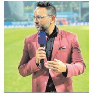
के दौरान और उन्होंने ठीक वैसा ही किया। यह महिला क्रिकेट के लिए एक बड़ा मंच है और खिलाड़ियों सहित हर कोई इसका बेसब्री से इंतजार कर रहा था। मैच समाप्त होने के बाद स्पॉट्स18 और जियोसिनेमा के डब्ल्यूपीएल विशेषज्ञ पटेल ने कहा: इसलिए, मुझे यकीन है कि हर कोई नर्वस था। लेकिन टूर्नामेंट की अच्छी शुरुआत के लिए यह महत्वपूर्ण था। मुंबई इंडियंस ने इसे बहुत अच्छा किया, एक विस्फोटक शुरुआत की। हमें यकीन है कि आने वाले दिनों में और अधिक दिलचस्प मैच होंगे।

भारत के पूर्व विकेटकीपर-बल्लेबाज पार्थिव पटेल का मानना है कि उद्घाटन महिला प्रीमियर लीग (डब्ल्यूपीएल) के शुरुआती मैच में मुंबई इंडियंस की गुजरात जायंट्स पर 143 रन की बड़ी जीत टूर्नामेंट के लिए सही शुरुआत है। लेकिन अभी और भी बहुत कुछ होना बाकी है। उन्होंने कहा: टॉस हारने के बाद मुंबई इंडियंस के लिए अच्छी शुरुआत करना बहुत महत्वपूर्ण था। खासकर, पावरप्ले