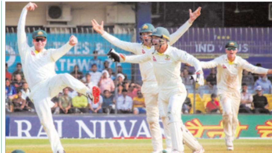
भारत को डब्ल्यूटीसी फाइनल के लिए अहमदाबाद टेस्ट जीतना जरूरी

एजेंसी। इंदौर इंदौर के होल्कर स्टेडियम में आस्ट्रेलिया ने यहां बॉर्डर-गावस्कर ट्रॉफी के तीसरे टेस्ट के तीसरे दिन भारत को 9 विकेट से हरा दिया। इस जीत का मतलब है कि ऑस्ट्रेलिया ने लंदन के द ओवल में 7-11 जून तक होने वाले वर्ल्ड टेस्ट चैंपियनशिप फाइनल के लिए क्वालीफाई कर लिया है। ऑस्ट्रेलियाई पारी की बात करें तो बल्लेबाज ट्रेविस हेड और लाबुसेन ने 78 रन की नाबाद अर्धशतकीय साझेदारी निभाई। वहीं, मैन ऑफ द मैच की ट्रॉफी गेंदबाज नाथन लियोन को मिली। इससे पहले दूसरे दिन 60.3 ओवर में भारत 163 रन पर सिमट गया था, जिससे कंगारूओं को 76 रनों का जीत के लिए लक्ष्य मिला था।