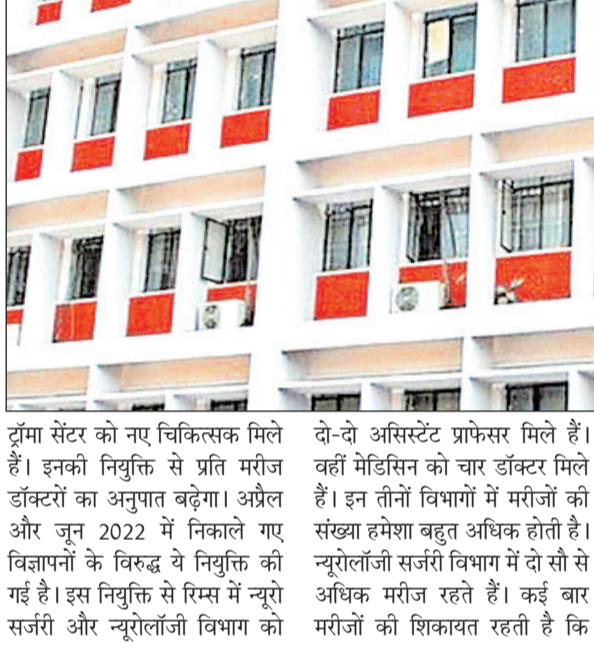
ट्रॉमा सेंटर को नए चिकित्सक मिले हैं। इनकी नियुक्ति से प्रति मरीज डॉक्टरों का अनुपात बढ़ेगा। अप्रैल और जून 2022 में निकाले गए विज्ञापनों के विरुद्ध ये नियुक्ति की गई है। इस नियुक्ति से रिम्स में न्यूरो सर्जरी और न्यूरोलॉजी विभाग को

नवीन मेल संवाददाता। रांची रिम्स प्रबंधन डॉक्टरों की कमी दूर करने की कवायद में लग गया है। रिम्स के विभिन्न विभागों में 26 नए चिकित्सकों की नियुक्ति की गई है। साथ ही छह को वैटिंग लिस्ट में रखा गया है। चार प्रोफेसर, दो मेडिकल ऑफिसर, 16 अस्सिस्टेंट प्रोफेसरों और एग्जिस्यूटिव प्रोफेसर दो के पद पर नियुक्ति की गई है। वहीं चार मेडिकल ऑफिसर, दो अस्सिस्टेंट प्रोफेसरों को वैटिंग में रखा गया है। ऑर्थोपेडिक, ऑर्थोपेडिक ट्रामा