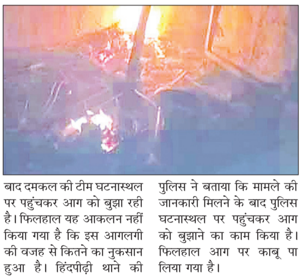
बाद दमकल की टीम घटनास्थल पर पहुंचकर आग को बुझा रही है। फिलहाल यह आकलन नहीं किया गया है कि इस आगलगी की वजह से कितने का नुकसान हुआ है। हिंदीपौड़ी थाने की

नवीन मेल संवाददाता गैस में आग लगने की घटना आये दिन देखने को मिल रही है। लोग इसका शिकार होते जा रहे हैं। हम सभी इसके प्रति काफी सतर्क होने की जरूरत है। जब भी रसोई में आप खाना बनाते हैं तो इसके प्रति काफी सतर्क होना चाहिए। उसे अच्छी तरह से बंद और चूल्हों की जांच करानी चाहिए। कुछ इसी तरह की मामला हिंदीपौड़ी थाना क्षेत्र स्थित माली टोला में शुकुवार की सुबह गैस सिलेंडर फटने से घर में आग लग गई। आग में सभी सामान जलकर राख हो गए। घटना की जानकारी मिलने के