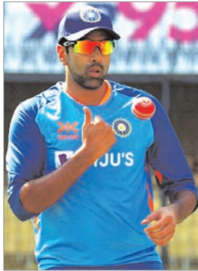
अश्विन पहली बार 2015 में टेस्ट रैंकिंग में शीर्ष पर पहुंचे थे। अश्विन ने दिल्ली टेस्ट में 6 विकेट हासिल

एजेंसी। नई दिल्ली भारत के ऑफ स्पिनर रविचंद्रन अश्विन बुधवार को आईसीसी की गेंदबाजों की ताजा टेस्ट रैंकिंग में दो स्थान के फायदे से शीर्ष स्थान पर पहुंच गए हैं। अश्विन ने इंग्लैंड के अनुभवी तेज गेंदबाज जेम्स एंडरसन को पीछे छोड़ते हुए शीर्ष स्थान हासिल किया। वेलिंगटन टेस्ट में न्यूजीलैंड के हाथों इंग्लैंड की हार के बाद एंडरसन दूसरे स्थान पर खिसक गए। 36 वर्षीय