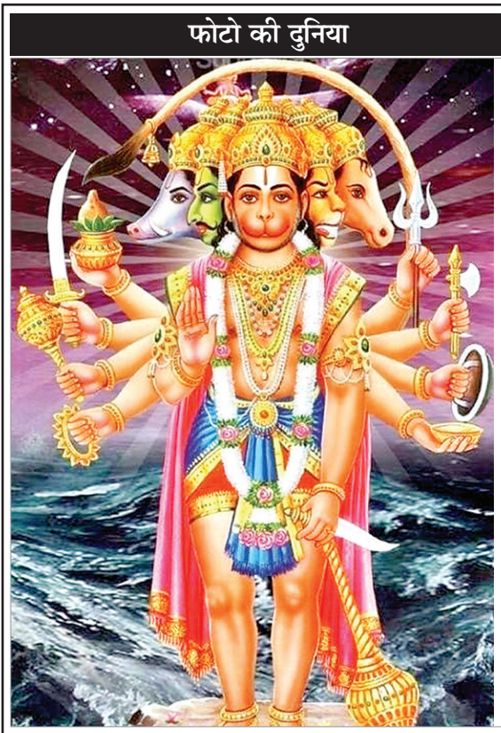
फोटो की दुनिया

बदलाव करे, अन्यथा बेरोजगारी-महंगाई के नये दौर में शिक्षा-स्वास्थ्य समेत हर क्षेत्र में निजी कम्पनियों के शोषण-दोहन का जो सामना आमलोग कर रहे हैं, वह पार्टी के रणनीतिकारों पर भारी पड़ सकती है। अनुभव बताता है कि निजीकरण गलत बात नहीं है, लेकिन अधिकारियों-उद्यमियों के पारस्परिक सांठगांठ से प्रभावित राजनेताओं द्वारा जनहित में नियम-कानून ही नहीं बनाना एक ऐसा रोग है, जो नई आर्थिक दासता तो दे ही रहा है, साथ ही आम आदमी को समुचित गुणवत्तायुक्त जनसुविधाओं से भी वंचित कर रहा है। सवाल है कि जब पैसे खर्च करने के बावजूद सही सुविधाएं पैसे खर्चने वाले को नहीं मिले और गलत कार्य करने वाले लोगों में प्रशासन का खौफ भी नहीं रहे, तो फिर सरकार का होना और न होना, कोई मायने नहीं रखता।