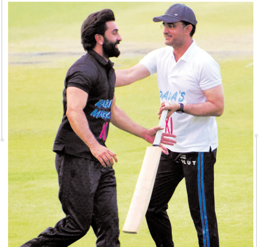
कोलकाता : पूर्व भारतीय क्रिकेट कप्तान सौरव गांगुली कोलकाता के ईडन गार्डन्स में फिल्म की शूटिंग के दौरान अभिनेता रणवीर कपूर के साथ।

उच्च पदस्थ पदाधिकारियों के खिलाफ यौन उत्पीड़न के आरोपों की जांच करने वाली दोनों समितियों का सदस्य है। इन सभी ने समिति की कार्यवाही के प्रति बहुत अविश्वास पैदा किया है। मैं निराश महसूस कर रही हूँ। एक निष्पक्ष और न्यायोचित जांच होनी चाहिए, इस दिशा में इस समिति के सदस्य के रणनीतिक प्रयास कमजोर करने के भी हैं। मैं अनुरोध करता हूँ कि इस तरह से अपने पद का उपयोग करने के लिए सदस्य के खिलाफ कड़ी कार्रवाई की जाए और उन्हें तुरंत समिति से हटा दिया जाए।