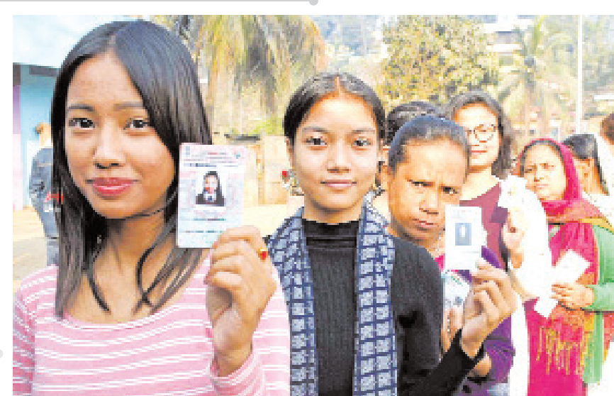
तुरा : मेघालय विधानसभा चुनाव के लिए मेघालय के तुरा में सोमवार, 27 फरवरी, 2023 को एक मतदान केंद्र पर वोट डालने के लिए कतार में खड़े मतदाता।

उतनी ही आसानी से अंतिम मील तक पहुंचने का हमारा लक्ष्य पूरा हो जाएगा। प्रधानमंत्री ने दूरदराज के क्षेत्रों तक पहुंचने में सुशासन की शक्ति को दर्शाने के लिए मिशन इंद्रधनुष और कोरोना महामारी में टीकाकरण और वैक्सिन कवरेज में नए दृष्टिकोण का उदाहरण दिया। साथ ही संतुष्टि की नीति के पीछे की सोच पर चर्चा की। प्रधानमंत्री ने कहा कि अंतिम मील तक पहुंचने का दृष्टिकोण और संतुष्टि नीति एक-