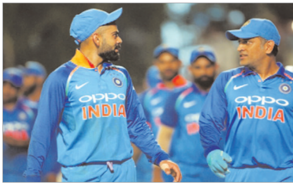
भारत के लिए खेले हैं और 25000 से ज्यादा रन बनाये हैं। उन्होंने कहा: इस दौर के दौरान

कोहली ने आरसीबी के पांडकास्ट सीजन 2 पर बात करते हुए धोनी के साथ अपने रिश्तों के कुछ पहलुओं पर रोशनी डाली। इंडियन प्रीमियर लीग (आईपीएल) 2023 सत्र के अगले संस्करण से पहले 10 संस्करणों के पहले संस्करण में उन्होंने यह बात कही। कोहली के हवाले से उनकी आईपीएल टीम रॉयल चैलेंजर्स बेंगलुरु (आरसीबी) ने कहा : मैंने अपने करियर में एक अलग किस्म का अनुभव किया। कोहली ने 15 वर्षों के अपने करियर में 106 टेस्ट, 271 वनडे और 115 टी-20 मैच