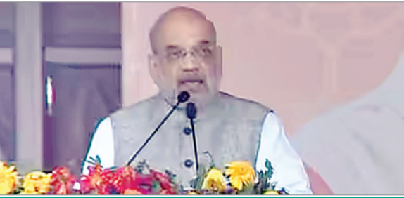
जब लोकतंत्र बचेगा तभी होगी राजनीति : लालू

एजेन्सी। चंपारण केन्द्रीय गृह मंत्री और बीजेपी नेता अमित शाह ने बिहार के चंपारण में रैली को संबोधित किया। इस दौरान उन्होंने बिहार के सीएम नीतीश कुमार पर जमकर निशाना साधा। अमित शाह ने कहा, सत्ता के लिए नीतीश कुमार जंगलराज वालों के साथ बैठ गए। उनके लिए बीजेपी के रास्ते अब बंद हैं। अमित शाह ने कहा, हमारा सपना था नीतीश को सीएम बनाने का। हमने बनाया भी, पर नीतीश बाबू को हर तीन महीने पर पीएम का सपना आता है। अमित शाह ने कहा, सत्ता के लिए नीतीश कुमार लालू प्रसाद की गोदी में बैठ गए। सोनिया गांधी के चरणों में लोट गए। नीतीश कुमार बहुत आया राम गया राम कर लिए। अब नीतीश बाबू के लिए बीजेपी का दरवाजा हमेशा के लिए बंद हो गया है। शाह ने तंज करते हुए कहा, नीतीश बाबू पीएम बनने के लिए विकासवादी से अवसर वादी बने लेकिन पीएम की जगह खाली नहीं है। 2024 में भी मोदी जी ही आने वाले हैं। नीतीश ने बिहार का