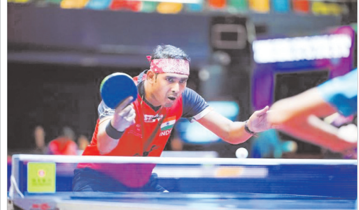
राष्ट्रमंडल खेलों के पदक विजेता अचंत शरत कमल, जी सत्यन और शीर्ष महिला खिलाड़ी मणिका बत्रा 27 फरवरी से पांच मार्च तक होने वाले विश्व टेबल टेनिस (डब्ल्यूटीटी) स्टार कन्टेंडर गोवा 2023 में भारत की चुनौती संभालेंगे। डब्ल्यूटीटी स्टार कन्टेंडर भारत में आयोजित होने वाला सबसे बड़ा टेबल टेनिस टूर्नामेंट है। पणजी के डॉ. श्यामा प्रसाद मुखर्जी इंडोर स्टेडियम में होनेवाले इस टूर्नामेंट में शीर्ष अंतरराष्ट्रीय सितारे उतरेंगे।