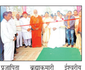
प्रजापिता ब्रह्माकुमारी ईश्वरीय

नवीन मेल संवाददाता। रांची रांची के पिठौरिया के नवा टोली स्थित महाशिवरात्रि पर प्रजापिता ब्रह्माकुमारी ईश्वरीय विश्वविद्यालय में सात दिवसीय 12 ज्योतिर्लिंग दर्शन मेले का शुभारंभ धूमधाम से किया गया। मौके पर मुख्य अतिथि के रूप में