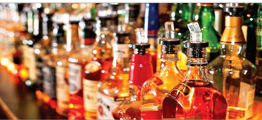
व्यक्ति ने अपना नाम नहीं छापने का

व्यक्ति ने अपना नाम नहीं छापने का अपील करते हुए कहा है कि शराब