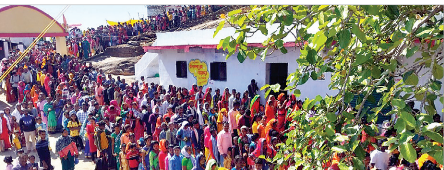
पूजा-अर्चना की। इधर श्रद्धालुओं का आगमन देर शाम तक होते रहा। इधर माघ पूर्णिमा मेला के मौके पर धाम में आने वाले श्रद्धालुओं के मद्देनजर धाम विकास समिति के द्वारा व्यापक प्रबंध किए गए थे। गुफा

नवीन मेल संवाददाता। सिमडेगा श्रीरामरेखाधाम में रविवार को माघ पूर्णिमा के मौके पर हजारों की संख्या में श्रद्धालु पहुंचे। श्रद्धालुओं ने धाम के पवित्र धनुष कुंड में स्नान कर गुफा मंदिर में स्थापित देवी-देवताओं की पूजा-अर्चना की। इस मौके पर श्रद्धालुओं ने मंदिर में स्थापित भगवान राम, लक्ष्मण एवं माता सीता के साथ-साथ शिवलिंग एवं समीप में स्थित हनुमान मंदिर, शिवालय के साथ-साथ गरूड़ स्तंभ एवं रामरेखा बाबा की समाधि पर में