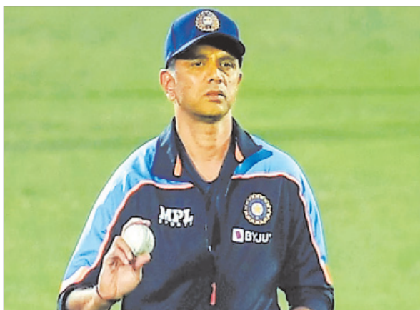
राहुल द्रविड़। टेस्ट टीम को फिर से एक साथ लाना अच्छा है। पिछले एक महीने में हमारे पास बहुत अधिक

एजेंसी। नागपुर भारत के मुख्य कोच राहुल द्रविड़ ने कहा है कि ऑस्ट्रेलिया के खिलाफ चार मैचों की टेस्ट सीरीज से पहले टीम के तैयारी शिविर में क्षेत्ररक्षण और कैच पकड़ने पर जोर दिया गया है। उन्हें लगता है कि आगामी बॉर्डर-गावस्कर ट्रॉफी के दौरान यह काफी महत्वपूर्ण होगा। उन्होंने कहा, हर कोई वास्तव में अच्छी स्थिति में दिख