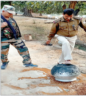
जावा नष्ट किया गया। साथ ही शराब बनाने वाले बर्तनों को भी तोड़ दिया

नवीन मेल संवाददाता बोलबा। बोलबा प्रखंड के अवाग एवं तलमंगा गांव में अवैध शराब बिक्री के खिलाफ पुलिस ने किया छापामारी एवं भारी मात्रा में महुआ जावा नष्ट किया गया। इस मौके पर बोलबा प्रखंड के अवाग तूरी टोली, बाजार टोली, स्कूल टोली सहित तलमंगा स्कूल टोली, हरिजन बस्ती में अवैध शराब बिक्री के खिलाफ बोलबा पुलिस ने किया छापामारी। इस मौके पर भारी मात्रा में महुआ