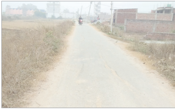
ठंडी हवा चलने की वजह से अधिकतम तापमान पहली बार 20 ग्राडियों की रफ्तार प्रभावित हुई। कोहरे और ठंडी हवाओं से दिन सूर्य के दर्शन तक नहीं हुए।

नवीन मेल संवाददाता हुसैनाबाद। पलामू जिले के हुसैनाबाद में सुबह से ही घनी कोहरे की घनी चादर सुबह तक बनी रही। पूरे दिन धूप नहीं निकलने से लोगों को परेशानियों का सामना करना पड़ा। शीतलहर व कोहरे की वजह से वाहनों की रफ्तार पर ब्रेक लगा। बचते-बचाते लोग किसी तरह सफर तय कर रहे थे। ठंड की वजह से भी लोग परेशान दिखे। स्कूल जाने वाले बच्चों को काफी परेशानी झेलनी पड़ी। सोमवार से ही कोहरा पड़ने की शुरुआत हो गई। सुबह से ही