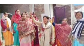
लोहरदगा जिले के अलग-अलग थाना क्षेत्र में दुष्कर्म एवं हत्या का मामला आने के बाद जिले की महिलाओं में बची आक्रोश देखने को मिल रहा है।

दुष्कर्म व हत्या से महिलाओं में आक्रोश, लेशियों को कड़ी सजा देने की आवाज बुलंद