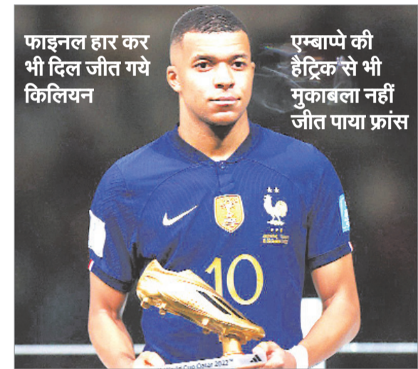
फाइनल हार कर भी दिल जीत गये किलियन एम्बाप्पे की हैट्रिक से भी मुकाबला नहीं जीत पाया फ्रांस

अर्जेंटीना के निकोलस ओटोमंडी ने बॉक्स के अंदर फ्रांस के खिलाड़ी पर फाउल कर दिया। रेफरी ने इसपर पेनल्टी दे दी। पेनल्टी ली किलियन एम्बाप्पे ने। 80वें मिनट में गोल इसे गोल में बदलकर उन्होंने अपनी टीम की वापसी करवाई। स्कोर 2-1 हो गया। एम्बाप्पे ने गोल का जश्न