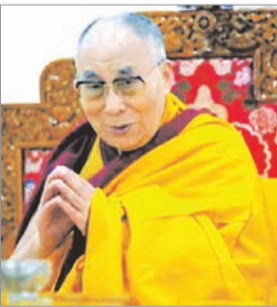
अफ्रीका और एशिया में चीन

चीन के लिए अच्छा है और न ही हमारे लिये। वैसे मेरा मानना है कि चीजें सुधर रही हैं और यूरोप,