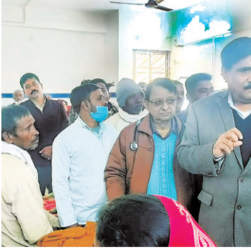
कार्य के लिए आते हैं मजदूर

घायल मजदूरों के अनुसार पिकअप में 30 लोग सवार थे। जबकि नौसिखुआ चालक पिकअप चला रहा था। तेज रफ्तार को ले