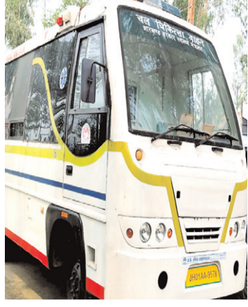
अनुसार सितंबर महीने से जिले में चलंत वाहन बंद हो गए हैं जिले में तीन चलंत वाहन हैं जिसमें एक राज्य स्तर से चलाए जाते हैं। वहीं दो जिला स्तर से चलाए जाते हैं। राज्य स्तर के चिकित्सा वाहन का टेंडर नहीं हुआ

नवीन मेल संवाददाता गढ़वा। झारखंड राज्य में चिकित्सकों की कमी को देखते हुए सरकार ने चलंत चिकित्सा वाहन की शुरूआत की थी। शुरूआती दौर में चलंत चिकित्सा वाहन से सुदूर ग्रामीण इलाकों के लोगों को काफी लाभ मिलता था। चलंत चिकित्सा वाहन आधुनिक सुविधा से सुसज्जित होते थे। इसमें मामूली एक्स-रे से लेकर अल्ट्रासोनोग्राफी की भी व्यवस्था होती थी। वाहन में लैब के साथ जनरेटर भी होते थे। जैसे-जैसे इसका समय बीतता गया, जैसे जैसे एनजीओ व विभागीय मिलीभगत से चलंत चिकित्सा वाहन की व्यवस्था भी धरातल नाम मात्र की रह गई है। वर्तमान चलंत चिकित्सा वाहन में सिर्फ एक्स-रे व लैब की व्यवस्था है। फिलहाल सभी चिकित्सा वाहन बंद है उसके कारण ग्रामीण इलाकों में चिकित्सा व्यवस्था का लाभ नहीं मिल पा रहा है। जानकारी के