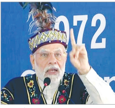
फुटबॉल मैदान में ही आपसे संवाद कर रहा हूं।

शिलांग (एजेंसी)। प्रधानमंत्री नरेंद्र मोदी ने रविवार सुबह मेघालय के शिलांग में पूर्वोत्तर परिषद के स्वर्ण जयंती समारोह में शिरकत की। कार्यक्रम में केंद्रीय गृह मंत्री अमित शाह, केंद्रीय कानून मंत्री किरन रिजजू, केंद्रीय मंत्री सर्वानंद सोनोवाल और जी किशन रेड्डी, पूर्वोत्तर के सभी राज्यों के राज्यपाल और मुख्यमंत्रियों समेत अन्य गणमान्य लोग मौजूद रहे। वहीं, शिलांग में अपने संबोधन में पीएम मोदी कतर में फीफा वर्ल्ड कप फाइनल का जिक्र करते हुए कहा कि आज एक संयोग ऐसा बना है कि जब फुटबॉल विश्व कप का फाइनल खेला जाना है, मैं