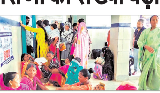
गर्म-ठंडा मौसम में रहने पर भी बीमारी का खतरा रहता है। ऐसे में प्रत्येक व्यक्ति को यह ध्यान रखना चाहिए कि ठंडी वातावरण से निकले है यानी एसी, कूलर से बाहर निकले है तो थोड़ी देर बाहर के मौसम में बैठे उसके बाद धूप में निकले। प्रतिदिन अलग-अलग मौसम का मिजाज रहा है दिन में गर्म और उमस वही रात में ठंड लग रहा है ऐसे में शरीर में दर्द औरबुखार हो सकते हैं।

वहीं बदलते मौसम के कारण के वायरल फीवर के मरीजों की संख्या बढ़ रही है। प्रत्येक मरीज में डई से तीन तक सर्दी बुखार बदन में दर्द रहता है बच्चे, महिलाओं के स्वास्थ्य पर भी असर दिखने लगा है। लोग सर्दी, खासी, बुखार, उल्टी, दस्त का शिकार हो रहे है।