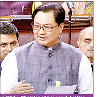
उनका कहना था कि सरकार सर्वोच्च न्यायालय के साथ उच्च न्यायालय से कई बार कह चुकी है कि उनकी