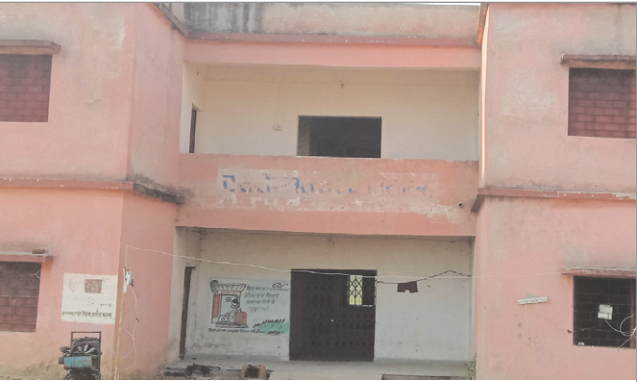
स्कूल में लटकता ताला

नवीन मेल संवाददाता नावा बजार। पलामू जिले के नावाबाजार प्रखंड स्थित बसना स्त्रोनत उच्च विद्यालय के नवनिर्मित भवन में पांच वर्षों से ताला लटका है। जिसके कारण विद्यालय भवन में शैक्षणिक कार्य प्रभावित हो रहा है। विद्यालय के बच्चे मध्य विद्यालय कि पुराने भवनों में पढ़ने को विवश है। जहां शिक्षक व बच्चों दोनों को परेशानी का सामना करना पड़ रहा है। बार-बार विभागीय अधिकारियों से मांग किये जाने के बावजूद नवनिर्मित भवन में विद्यालय संचालन का निर्देश नहीं दिया जा रहा है। जबकि एनएच 39 चौड़ीकरण फोरलेन के निर्माण कार्य में विद्यालय भवन आधे से अधिक प्रभावित हो रहे हैं। सड़क चौड़ीकरण कार्य को लेकर सड़क के किनारे जमीन का अधिग्रहण किया जा रहा है। जानकारी के अनुसार बसना मध्य विद्यालय का उद्क्रमण उच्च विद्यालय के रूप में किया गया। साथ