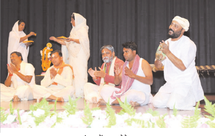
नाट्य मंचन में भाग लेते कलाकार

नवीन मेल संवाददाता मेदिनीनगर। कला और संस्कृति को समर्पित पलामू की संस्था मासूम आर्ट ग्रुप के कलाकारों ने चंडीगढ़ में अपनी नाट्य प्रस्तुति देकर दर्शकों को मंत्रमुग्ध कर दिया। चंडीगढ़ में हरियाणा व पंजाब के अरविंदो सोसाइटी के द्वारा महर्षि अरविंदो के 150वां जयंती वर्ष के उपलक्ष में कार्यक्रम का आयोजन किया गया था। महात्मा गांधी इंस्टीट्यूट ऑफ पब्लिक एडमिस्ट्रेशन ऑडिटोरियम में आयोजित इस कार्यक्रम में पंजाब के राज्यपाल बनवारी लाल पुरोहित मुख्य अतिथि के रूप में मौजूद थे। इस अवसर पर पलामू के कलाकारों द्वारा मंचित नाटक की सभी ने तारीफ की। नाटक की रचना महर्षि अरविंदो ने जेल में की थी। मासूम आर्ट ग्रुप के कलाकारों ने चंडीगढ़ में महर्षि अरविंदो द्वारा रचित नाटक हरिमोहन का सपना का मंचन किया। यह नाटक महर्षि के द्वारा श्रीकृष्ण के कथित वातालाप पर आधारित है। इसकी