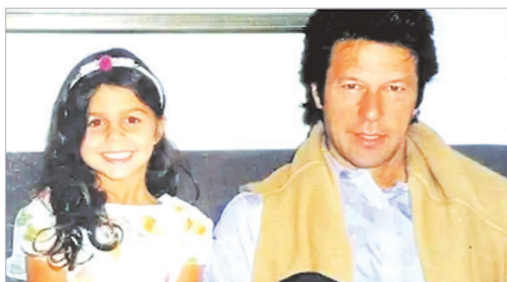
इमरान खान हैं। इस्लामाबाद हाईकोर्ट ने एक जनहित याचिका पर सुनवाई करते हुए इमरान खान, केंद्र सरकार और इलेक्शन कमीशन को नोटिस करके इस बारे में