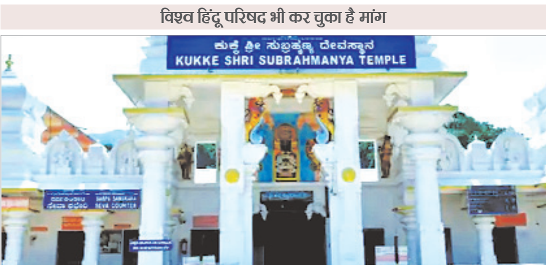
इससे पहले विश्व हिंदू परिषद ने कोल्लूर मंदिर के अधिकारियों से सुधार के लिए जाने और अनुष्ठान को प्रदीप पूजा कहने का आग्रह किया था। हालांकि, मंदिर के कार्यकारी अधिकारी ने स्पष्ट किया था कि मंदिर के रिकॉर्ड में कहीं भी शांम की आरती का नाम सलाम मंगलाआरती नहीं था।