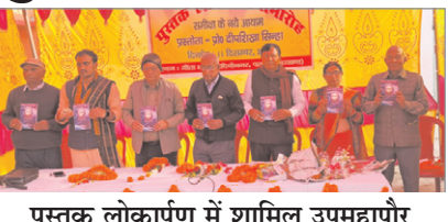
पुस्तक लोकार्पण में शामिल उपमहापौर