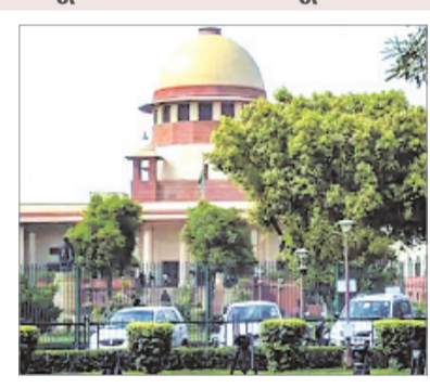
न्यायालय को आश्चर्य कि वो मिनिस्ट्री से इस बारे में सलाह करेंगी। अटॉर्नी जनरल ने कोर्ट से कहा कि दो बार खुद सर्वोच्च न्यायालय के कॉलेजियम ने अपनी ही सिफारिशों में फेरबदल किया था, क्योंकि केंद्र ने उसके सुझावे नाम वापस कर दिये थे। इससे झलक मिली कि कॉलेजियम ने जो सिफारिश की थी वो अपने आप में कहीं न कहीं अधूरी थी। जिस पर जस्टिस संजय किशन कोल की बेंच ने कड़ा रुख दिखाते हुए कहा कि एक-दो बार के उदाहरण से केंद्र को लाइसेंस नहीं मिल जाता कि वो कॉलेजियम सिस्टम को नजरअंदाज करना शुरू कर दे।

नयी दिल्ली। सर्वोच्च न्यायालय ने कॉलेजियम सिस्टम को सिफारिशों को नजरअंदाज करने पर केंद्र को कड़ी फटकार लगायी। न्यायालय ने कहा कि यह एक कानून है और इस पर पूरी तरह से ■ कुछ लोगों की दिक्कतों से हमें फर्क नहीं पड़ता ■ संसद के बनाये कानूनों को कुछ लोग मानने से इनकार कर देते हैं, तो फिर क्या स्थिति होगी?