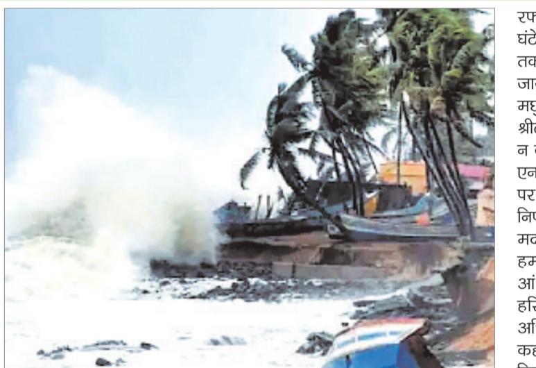
तमिलनाडु, पुडुचेरी और आंध्र प्रदेश के कुछ इलाकों में भारी बारिश होने की संभावना है। 10 दिसम्बर को इन क्षेत्रों में दोपहर तक तेज हवाओं की