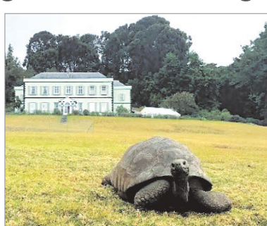
प्रशासन के पास कोई प्रमाणिक दस्तावेज मौजूद नहीं है। हालांकि, इसकी उम्र इससे भी कई ज्यादा हो सकती है। लोकल लेवल पर माना जाता है

नयी दिल्ली (एजेंसी)। जोनाथन को धरती का सबसे बड़ा कछुआ होने की आधिकारिक घोषणा पहले ही की जा चुकी है। इसकी उम्र 190 साल है। गिनीज वर्ल्ड रिकॉर्ड्स ने इसे सबसे बड़ा कछुआ का खिताब दे दिया है। जोनाथन सेशेल्स का जायंट कछुआ है। यह नेपोलियन के मरने के कुछ ही समय बाद पैदा हुआ था और अब आधिकारिक तौर पर पृथ्वी का सबसे पुराना जीवित जानवर है। जोनाथन द सेशेल्स जायंट कछुआ सुदूर दक्षिण अंटार्कटिक के सेंट हेलेना में अपना 190वां जन्मदिन मना रहा है। उसके बर्थडे पर कई कार्यक्रमों का आयोजन किया जा रहा है। जोनाथन के जन्म को लेकर स्थानीय