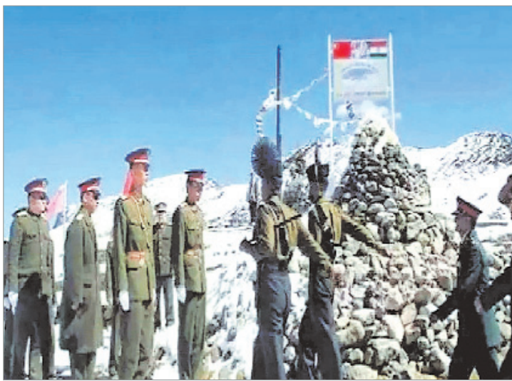
भारत और चीन के बीच लंबे समय से चल रहा विवाद

किया था कि उसकी सेनाएं पीछे हटेंगी। चीन का भारत के साथ पिछले लंबे समय से सीमा विवाद चल रहा है। अमेरिकी सांसद राजा कृष्णमूर्ति ने दुनिया के सामने चीन के खतरनाक इरादे का खुलासा किया है। उन्होंने कहा कि भारत के साथ लगती वास्तविक नियंत्रण रेखा (एलएसी) के पास चीन द्वारा सैन्य चौकी का निर्माण किया जाना अपने पड़सियों के प्रति चीनी आक्रामकता का चिंताजनक संकेत है। चीन लगातार एलएसी पर अलग-अलग तरह के निर्माण कर रहा है, जिसकी खबरें और तस्वीरें आए दिन सामने आती हैं। एलएसी पर एक ओर तो चीन अपने सैनिकों को पीछे हटाने की बात करता है, लेकिन दूसरी ओर उसकी सेना वहां हेडक्वार्टर और सैन्य चौकियों का निर्माण कर रही है।