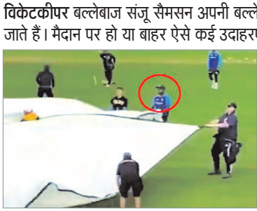
क्योंकि उन्होंने पहले गेम में 38 गेंदों में 36 रन बनाए थे। हालांकि, सैमसन ने बिना खेले भी लोगों का दिल जीता और जब मैच स्थल पर तेज हवा के कारण कर्मचारियों को ग्राउंड को कवर करने में कठिनाई का सामना करना पड़ रहा था, तभी सैमसन मदद के लिए आगे आते हैं और ग्राउंड कवर करने में सहायता करते हैं।

कतर (एजेंसी)। मेन इन ब्लू के न्यूजीलैंड दौरे में भारत की अंतिम एकादश में नियमित मौका नहीं मिलने के बावजूद स्टार बल्लेबाज संजू सैमसन के लिए प्रशंसकों का प्यार हैरान करनेवाला है। कतर में चल रहे फीफा कतर विश्व कप-2022 में प्रशंसकों ने सैमसन का समर्थन किया और उनके पोस्टर लेकर पहुंचे, जिसकी एक तस्वीर राजस्थान रॉयल्स द्वारा साझा की गई। राजस्थान रॉयल्स के आधिकारिक ट्विटर हैंडल से एक तस्वीर शेयर की गई है जिसमें फैंस हाथों में संजू सैमसन के पोस्टर लिए लेकर खड़े हैं। ऑकलैंड में शुरुआत को सीरीज के पहले वनडे में न्यूजीलैंड से सात विकेट से हारने के बाद टीम इंडिया में बदलाव की उम्मीद थी। ऐसा हुआ भी और एक अतिरिक्त गेंदबाज के लिए हरफनमौला दीपक हुड्डा को