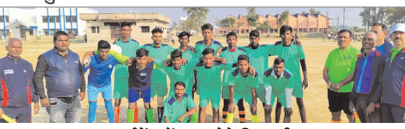
टूर्नामेंट में भाग लेते खिलाड़ी