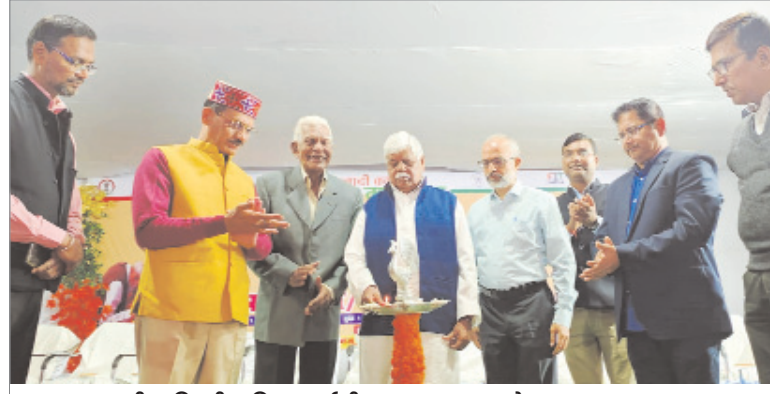
तीन दिवसीय चित्र प्रदर्शनी का उद्घाटन करते सांसद व अन्य