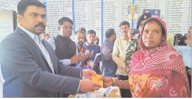
परिसंपत्तियों का वितरण करते उपायुक्त