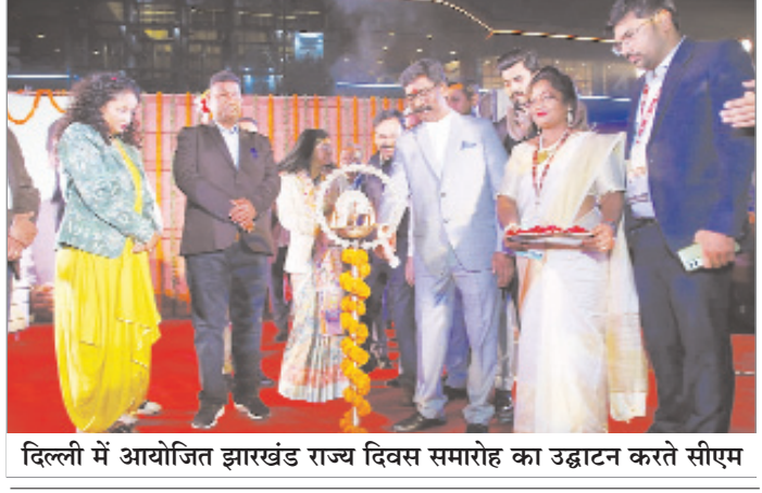
दिल्ली में आयोजित झारखंड राज्य दिवस समारोह का उद्घाटन करते सीएम

नवीन मेल संवाददाता रांची/नयी दिल्ली। देशवासी झारखंड आंखें। झारखंड में आप सभी का स्वागत है। यहां आकर देखिए झारखंड कितना खूबसूरत है और यह आगे बढ़ने की क्षमता रखता है। प्राकृतिक सौंदर्य से भरपूर इस राज्य में जब आप आयेगी तब यहाँ की धरा आपका दिल मोह लेगी। उक्त बातें मुख्यमंत्री हेमंत सोरेन ने कही। मुख्यमंत्री अंतर्राष्ट्रीय व्यापार मेला में आयोजित झारखंड दिवस समारोह में बतौर मुख्य अतिथि बोल रहे थे। मुख्यमंत्री ने कहा कि यह झारखंड के लिए गौरव की बात है। आज झारखंड के आदिवासी और मूलवासी शैक्षणिक, सामाजिक और राजनीतिक तौर पर अपनी अलग पहचान बनाने में लगे हैं और आज जहाँ हर जगह एक प्रतिस्पर्धा की स्थिति बनी है। हर किसी में अपनी क्षमता और हुनर है, जिसके बल पर वह अपनी पहचान बनाता है, जिस प्रगति मैदान में वर्षों पहले पढ़ाई के दौरान आया था, आज वहाँ अतिथि के रूप में आया है। मुख्यमंत्री ने कहा कि झारखंड के जिस परिवार को दो वक्त का भोजन सही से नहीं मिल पाता था, उस परिवार के बच्चे खेल में देश का प्रतिनिधित्व करते हैं। आज उन सभी हुनरमंद बच्चों को वर्तमान सरकार तराशने में लगी है और आनेवाली पीढ़ी को उनके लिए बेहतर मार्ग प्रशस्त करने के लिए रोज नये सोच