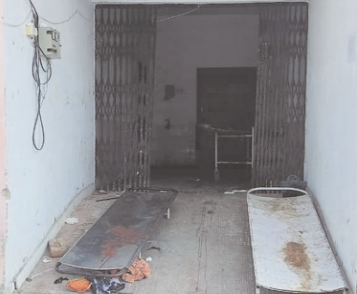
पोस्टमार्टम हाउस में गंदगी का अंबार

लावारिस लाश के दाह संस्कार के लिए पुलिस को जेब से खर्च करने पड़ते हैं पैसे