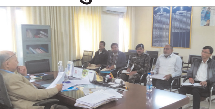
अवैध खनन को लेकर बैठक करते आयुक्त