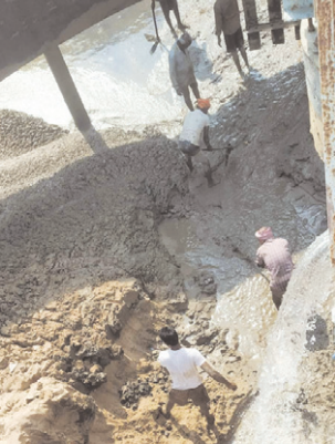
फिल्टर टंकी सफाई करते निगमकर्मों