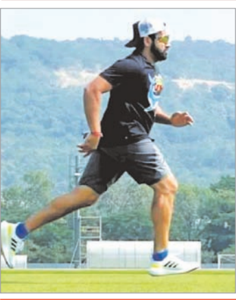
तस्वीरें इंस्टाग्राम पर लाखों लोगों ने तुरंत लाइक कीं और देखते ही देखते यह चर्चा

रोहित शर्मा सिर्फ वनडे-टेस्ट टीम की कप्तान संभालेंगे। हालांकि, अभी यह सिर्फ अटकलें हैं। रोहित शर्मा को पिछले साल टी-20 वर्ल्ड कप 2021 के बाद टीम इंडिया की कप्तान सौंपी गयी थी। इस दौरान उनकी अगुवाई में कई द्विपक्षीय सीरीज भारत ने जीती, लेकिन एशिया कप और टी-20 वर्ल्ड कप 2022 जैसे बड़े इवेंट में हार मिली। रोहित शर्मा अब सीधा बांग्लादेश दौरे पर दिखेंगे, जहां टीम इंडिया को वनडे और टेस्ट सीरीज खेलनी है।