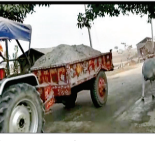
है कि इस्माइलपुर से तीन टंगा तक हर साल गंगा के कटाव से बचाव के लिए सरकार करोड़ों रुपए खर्च करती है। मगर माफिया लगातार बालू का खनन कर गंगा को आने का न्योता दे रहे हैं। मुख्यसंधन विभाग की मीते तो गंगा से करीब 500 मीटर की दूरी पर खनन किया जा सकता है। लेकिन इसके लिए टैंडर निकला जाता है और संबंधित ठेकेदार को लाइसेंस निर्गत किया जाता है। तीन टंगा और सैदपुर गांव के सड़क से सटे लोगों का कहना है कि खुलेआम ट्रैक्टर पर बालू ढोया जा रहा है। नवागछिया एसपी सुशांत कुमार सरोज ने कहा की सफेद बालू के अवैध खनन की जानकारी नहीं है। खनन विभाग और एसडीपीओ को इसकी जांच कर फिलॉस्फी के आदेश दिया गया है। बालू माफियाओं के खिलाफ सख्त कार्रवाई की जाएगी।

भागलपुर (एजेंसी)। जिले में गंगा किनारे सफेद बालू के अवैध खनन का कारोबार खूब फल-फूल रहा है। तीनटंगा दियारा स्थित जहाज घाट के समीप माफिया धड़ल्ले से अवैध रूप से बालू का खनन कर रहे हैं। इस कारण घाट किनारे बड़े-बड़े गड्ढे हो गए हैं, और इससे कटाव का खतरा उत्पन्न हो गया है। यह अवैध खनन गोपालपुर थाने से महज एक किलोमीटर की दूरी पर हो रहा है। अवैध बालू लंदे करीब 100 से अधिक ट्रैक्टर रोजाना यहां से गुजरते हैं। लेकिन पुलिस माफियाओं पर कार्रवाई की बात तो दूर, ट्रैक्टर चालकों से यह भी नहीं पूछती की किसके आदेश पर कहाँ से बालू ले जाया जा रहा है। खनन को लेकर ग्रामीणों में रोष है। लोगों का आरोप है कि बिना पुलिस या प्रशासन की मिलीभगत से यह कार्य संभव नहीं है। ईट-भट्टा में माफिया सफेद बालू बेचकर काला धन जमा करने में लगे हुए हैं। गंगा घाट से हर माह लाखों रुपये की अवैध बालू का खनन किया जा रहा है। जिसमें किसान से लेकर भू माफिया का कमीशन सेट है। गंगा से महज कुछ ही दूरी पर बालू माफिया लगातार खनन कर रहे हैं। उल्लेखनीय