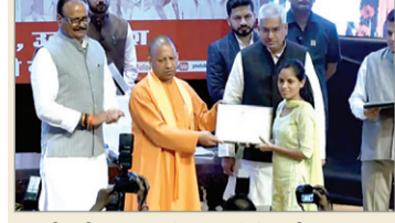
90 फीसदी महिलाएं हैं। आप ने बेहतरीन प्रशिक्षण लिया है तो नौकरी की कमी नहीं है। मानक के अनुसार भारत के साथ दुनिया भर में डॉक्टरों और स्टॉफ नर्सों की कमी है। उन्हें भेरे जाने की जरूरत है। राज्य सरकार के प्रयास की वजह से स्वास्थ्य सुविधाएं मजबूत हुई हैं। नवनि्युक्त नर्सों को सीटः मुख्यमंत्री ने कहा कि स्टॉफ नर्स स्वास्थ्य विभाग की रीढ़ होती हैं। उनकी भूमिका बेहद महत्वपूर्ण है। मरीज के सबसे करीब नर्स ही रहती है। आप का व्यवहार अच्छा होना चाहिए। आपके व्यवहार से भर्ती मरीज को यह अहसास होना चाहिए कि वह ठीक हो रहा है। अगर डॉक्टर, स्टॉफ नर्स का व्यवहार ठीक नहीं होगा तो मरीज तक ठीक नहीं हो सकता। सिस्टर कहकर आपको पूरा अस्पताल सम्मान भी देता है। इस सम्मान को आपको ही बनाकर रखना होगा।

उप में ही युवाओं को मिले रोजगार : मुख्यमंत्री योगी आदित्यनाथ ने कहा कि कोरोना कालखण्ड में दिल्ली, पंजाब, महाराष्ट्र में उप के श्रमिकों के साथ भेदभाव हुआ। देश चिंतित था कि इतनी बड़ी संख्या में श्रमिक उत्तर प्रदेश