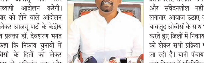
का जो भी मौका था उसे छिना जा रहा है। इस हकमारी के खिलाफ पिछड़ों में सरकार के खिलाफ रोष है। इसी अभियान के तहत कल सभी जिला मुख्यालयों पर विरोध प्रदर्शन किया जाएगा, जिसमें हजारों लोग शामिल होंगे। इसी क्रम में कल आजसू पार्टी की रांची जिला इकाई के सभी नेता, केंद्रीय पदाधिकारी और कार्यकर्ता मांग पत्र लेकर मोरारबादी स्थित बापू वाटिका से राजभवन कूच करेंगे।