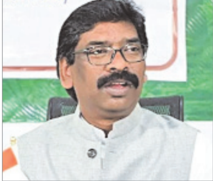
नवीन मेल संवाददाता