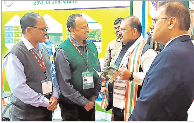
में अपनी भागीदारी कर रहा है। भारतीय शीम वोकल फॉर लोकल,लोकल टू अंतरराष्ट्रीय व्यापार मेला 2022 का ग्लोबल रखा गया है। उक्त मेले में

नवीन मेला संवाददाता नई दिल्ली/रांची। नई दिल्ली के प्रगति मैदान में पौयुष गौयल, मंत्री, वाणिज्य एवं उद्योग, उपभोक्ता मामले, खाद्य एवं सार्वजनिक वितरण और वस्त्र मंत्रालय, भारत सरकार के द्वारा भारतीय अंतरराष्ट्रीय व्यापार मेला 2022 का उद्घाटन किया गया। उक्त कार्यक्रम में अनुप्रिया पटेल, वाणिज्य एवं उद्योग राज्य मंत्री, सोम प्रकाश, वाणिज्य एवं उद्योग राज्य मंत्री एवं मिथिलेश ठाकुर, मंत्री पेयजल एवं स्वच्छता विभाग झारखण्ड सरकार एवं अन्य मंच पर उपस्थित थे। इस वर्ष झारखण्ड राज्य पार्टनर राज्य के रूप