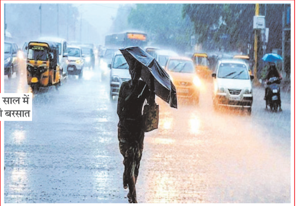
चेन्नई में 72 साल में 3री बार इतनी बरसात