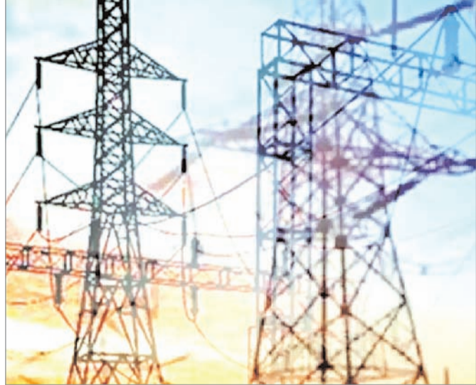
का इस्तेमाल करते हैं जिसके लिए मंत्रालय के आंकड़ों के मुताबिक, अक्टूबर, 2022 में बिजली की खपत

नयी दिल्ली (एजेंसी)। देश में बिजली की खपत अक्टूबर में एक साल पहले की तुलना में 1.64 प्रतिशत बढ़कर 114.64 अरब यूनिट हो गई। एक सरकारी आंकड़े में यह जानकारी दी गई। इस महीने अप्रत्याशित ढंग से भारी बारिश होने से तापमान में कमी आने से बिजली की जरूरत कम पड़ी। इस वजह से अक्टूबर में बिजली की मांग अपेक्षाकृत सुस्त रहता रहा। हालांकि, विशेषज्ञों का मानना है कि आने वाले महीनों में देश के उत्तरी राज्यों में ठंड बढ़ने से बिजली की मांग में तेजी आएगी। सर्दियों के मौसम में घरों को गर्म करने और रबी फसल सत्र में आर्थिक गतिविधियों में सुधार होने से एक बार फिर बिजली की खपत बढ़ेगी। दरअसल, फसलों की बुवाई एवं सिंचाई के लिए किसान ट्यूबवेल