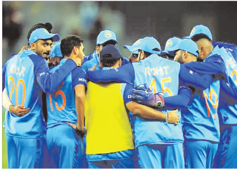
निजी कारणों से ब्रेक दिया गया है। वे शायद भारत बदलाव के आरंभ की अनदेखी नहीं की जा के लिए छोटे प्रारूप में खेल सकते हैं, लेकिन सकती। कार्तिक ने दक्षिण अफ्रीका के खिलाफ

एडिलेड (एजेंसी)। पूरी संभावना है कि आस्ट्रेलिया में चल रहा टी-20 विश्व कप दिनेश कार्तिक और रविचंद्रन अश्विन के लिए इस प्रारूप में अंतिम टूर्नामेंट हो, क्योंकि चेतन शर्मा की अगुआई वाली चयन समिति ने 2024 चरण को ध्यान में रखते हुए खेल के इस छोटे प्रारूप में बदलाव का दौर शुरू कर दिया है। हार्दिक पांड्या को 18 नवम्बर से न्यूजीलैंड के खिलाफ शुरू हो रही तीन मैचों की श्रृंखला के लिए सोमवार को टी-20 टीम का कप्तान बनाया गया। टीम को देखकर साफ संकेत मिलते हैं कि अगली पीढ़ी इस टी-20 विश्व कप के बाद जिम्मेदारी संभालने को तैयार है। विराट कोहली और रोहित शर्मा दोनों ने आराम की मांग की थी और केएल राहुल को