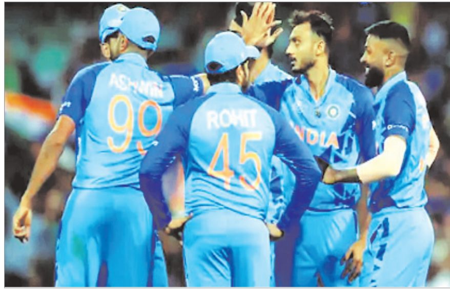
भारत के लिए बांग्लादेश से मुकाबला बेहद अहम खेलना है। यह मैच भारत के लिए काफी अहम हो गया है। अगर भारतीय टीम यह मैच हारती है तो फिर टीम इंडिया को अब बुधवार को बांग्लादेश से मैच

पर्य (एजेंसी)। टी-20 वर्ल्ड कप में रविवार को टीम इंडिया साउथ अफ्रीका से पांच विकेट से हार गयी। इस नतीजे के बाद सुपर-12 में ग्रुप-2 का समीकरण काफी बदल गया है। अब ग्रुप की छह में से पांच टीमों में अंतिम चार में पहुंचने की होड़ में हैं। नीदरलैंड की टीम रविवार को पाकिस्तान से हार गई। यह तीन मैचों में डच टीम की लगातार तीसरी हार है। यह सेमीफाइनल की होड़ से बाहर होने वाली ग्रुप-2 की पहली टीम बन गई है। रविवार के मुकाबलों से पहले टीम इंडिया ग्रुप-2 में सबसे अच्छी स्थिति में थी। भारत पर जीत के बाद अब इस स्थिति में साउथ अफ्रीका की टीम आ गई है। तीन मैचों से साउथ अफ्रीका के पांच पॉइंट्स हैं। उसके अब पाकिस्तान और नीदरलैंड से मैच बाकी हैं। दोनों मैच जीतने पर टीम 9 अंक के साथ टेबल टॉपर रहते हुए सेमीफाइनल में पहुंच जाएगी। एक मैच में हार के बाद भी साउथ अफ्रीका अंतिम चार में पहुंच सकता है। उसका नेट रन रेट 2.772 का है जो ग्रुप में सबसे बेहतर है।