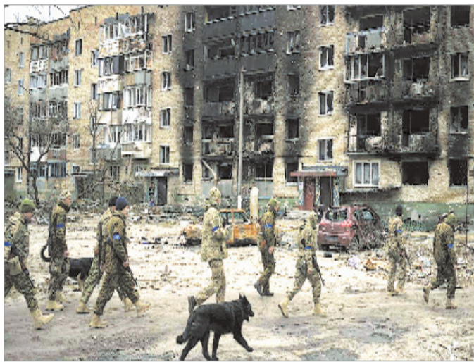
बनाकर जवाबी मिसाइल हमले तेज कर दिए हैं। आठ अक्टूबर को हुए एक

कि सभी भारतीय नागरिकों को उपलब्ध साधनों से तत्काल देश छोड़ने की सलाह दी जा रही है। भारतीय दूतावास ने अपनी एडवाइजरी में कहा कि भारतीय नागरिक सीमा तक पहुंचने के लिए दूतावास से मार्गदर्शन और सहायता के लिए संपर्क कर सकते हैं। दूतावास ने हंगरी, पोलैंड और रोमानिया में स्थित भारतीय दूतावास के फोन नंबर भी साझा किये हैं। जिसके जरिये भारतीय नागरिक निकासी के लिए संपर्क कर सकते हैं।