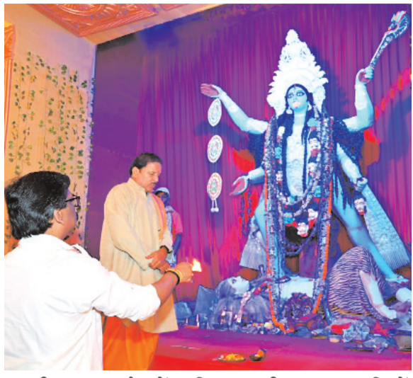
काली पूजा समारोह में शामिल हुए सीएम, राज्यवासियों की सुख-शांति-समृद्धि और खुशहाली की कामना की

रांची। मुख्यमंत्री हेमंत सोरेन ने कांसमॉस वृथ क्लब, लालपुर के पूजा पंडाल में मां काली की पूजा-अर्चना कर राज्य एवं राज्यवासियों के विकास, सुख-शांति-समृद्धि और खुशहाली की कामना की। मुख्यमंत्री ने कहा कि हम सभी के जिनगी में कई चुनौतियां आती रहती हैं। मां काली इन चुनौतियों से निपटने की शक्ति हम सभी को दें। मुख्यमंत्री ने कहा कि भारत विविधताओं वाला देश है। हमारे यहां हर धर्म-मजहब के लोग आपसी भाईचारा, प्रेम और सद्भाव के साथ रहते आ रहे हैं। हर धर्म के पर्व त्योहारों में हम सभी सम्मिलित होकर खुशियों को बांटते हैं। दरअसल हमारे देश में सदियों से त्योहारों को हर्षोल्लास और खुशी के साथ मनाने की परंपरा चली आ रही है। हम सभी को इस परंपरा को और मजबूत करना है। मुख्यमंत्री ने कहा कि अभी पर्व त्योहारों का मौसम चल रहा है। दशहरा और दिवाली मना चुके हैं और अब सोहराय, छठ महापर्व और बड़ा दिन समेत कई और पर्व त्योहारों को मनायेंगे।