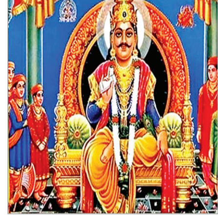
को दंड या मुक्ति देने में कोई समस्या चित्रगुप्त की पूजा इस वर्ष 27 अक्टूबर

पटना (एजेंसी)। कायस्थ परिवार के लोग कलम के आराध्य देव भगवान चित्रगुप्त की पूजा धूमधाम के साथ करते हैं। पौराणिक मान्यताओं के अनुसार, कायस्थ जाति को उत्पन्न करने वाले भगवान चित्रगुप्त का जन्म यम द्वितीया के दिन हुआ। कार्तिक मास के शुक्ल पक्ष की द्वितीया तिथि को भगवान चित्रगुप्त की पूजा की जाती है। हिंदू धर्म में चित्रगुप्त जी की पूजा का विशेष महत्व है। वह कायस्थों के आराध्य देव हैं। भगवान चित्रगुप्त ब्रह्मदेव की संतान हैं। वह ज्ञान के देवता हैं। उनको यमराज का सहायक देव माना जाता है। यमलोक के राजा यमराज को कर्मों के आधार पर जीव